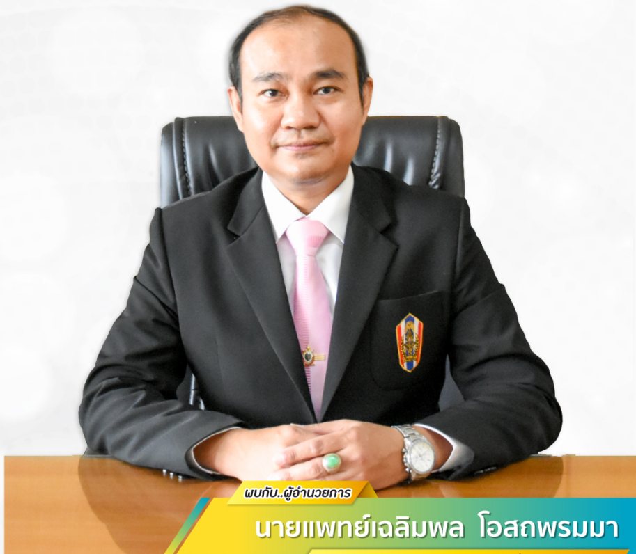
พบกับ..ผู้อำนวยการ