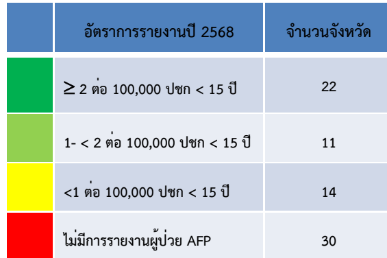
รูปที่ 1 อัตราการรายงานผู้ป่วยอัมพาตกล้ามเนื้ออ่อนปวกเปียกเฉียบพลันที่ไม่ใช่โปลิโอ (Non-Polio AFP rate) สะสมรายจังหวัด (วันที่ 1 มกราคม – 31 ตุลาคม 2568 N=148 ราย)