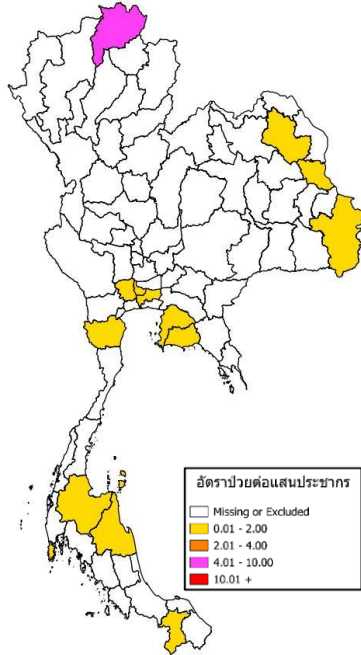
รูปที่ 4 อัตราป่วยโรคหัด (ผู้ป่วยยืนยัน และผู้ป่วยเชื่อมโยงทางระบาดวิทยา) จำแนกรายจังหวัด ตั้งแต่วันที่ 1 มกราคม – 18 พฤษภาคม 2569

กรมควบคุมโรค กระทรวงสาธารณสุข Department of Disease Control, Ministry of Public Health