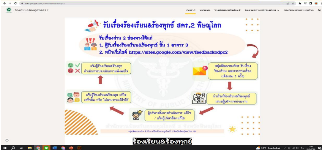
(Web site ร้องเรียนและร้องทุกข์ภายในหน่วยงาน)

จากมีผลคะแนนการสำรวจคุณธรรมและความโปร่งใสของหน่วยงานในปีงบประมาณพ.ศ.๒๕๖๖(๗๘.๒๕) ที่เพิ่มมากขึ้นจากปีงบประมาณพ.ศ. ๒๕๖๕ (๗๖.๖๕%) แสดงให้เห็นว่าสคร.๒พิษณุโลกมีพฤติกรรมที่ดีขึ้นเกี่ยวกับคุณธรรมจริยธรรม และการต่อต้านทุจริต