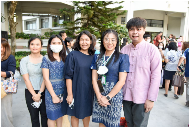
การสวมใส่ผ้าไทย

ส่งเสริมให้บุคลากรติด/ห้อยบัตรประจำตัว (ป้ายชื่อ) ตามระเบียบฯ