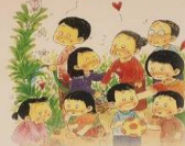
การทำบุญที่ใจ การให้เป็นกุศลและมีค่าเสมอ