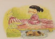
การนั่งสมาธิ เจริญสติใจให้มีภูมิคุ้มกันความไม่ซื่อสัตย์ ขอบใจให้เจริญขึ้น