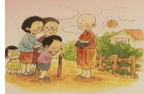
บุญเป็นว่า ความดีเป็นเบิกบานใจ เพราะได้ทำความดี และสร้างสรรค์ความเจริญงอกงามให้เกิดขึ้น

การมีชีวิตที่ดีงามและเป็นสุขในโลกทุกวันนี้ ต้องรู้จักคิด ใฝ่เรียนรู้สิ่งดีงาม และสร้างสรรค์คุณค่าให้แก่ชีวิต