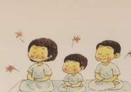
ฝึกใจให้สงบ งามเบา