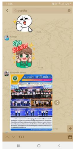
การประกาศทาง Line สคร.