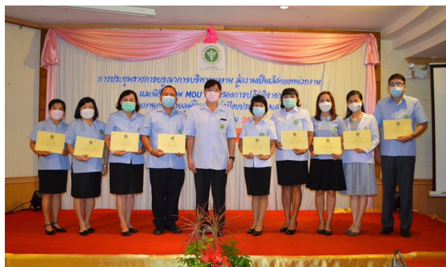
การประกาศในการประชุม