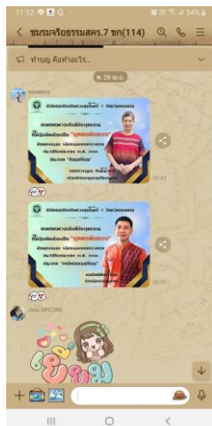
การประกาศทาง Line สศร. และ Line ชมรมจริยธรรม