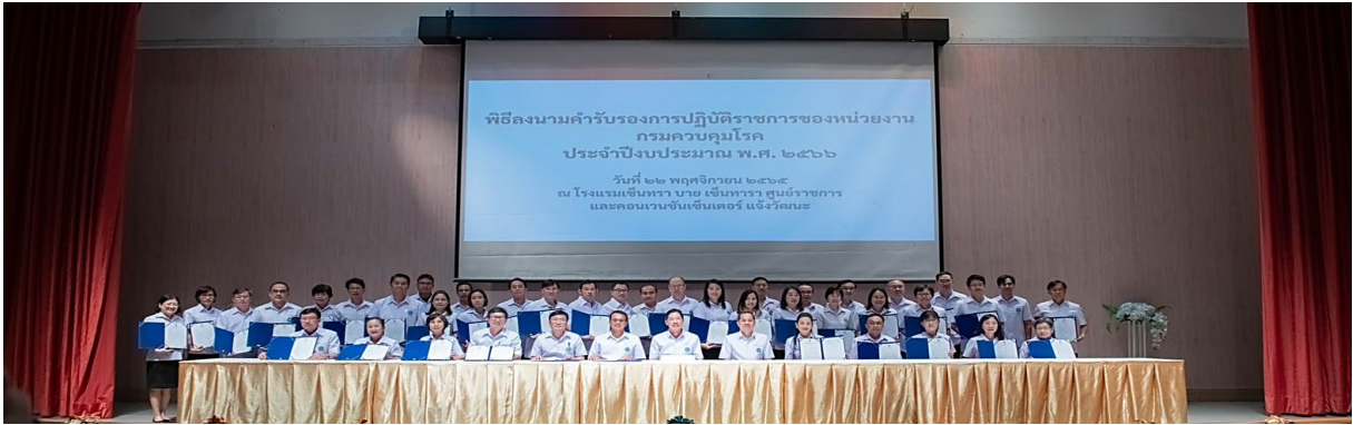
การลงนามคำรับรองการปฏิบัติราชการของหน่วยงาน กรมควบคุมโรค ประจำปีงบประมาณ พ.ศ. ๒๕๖๖