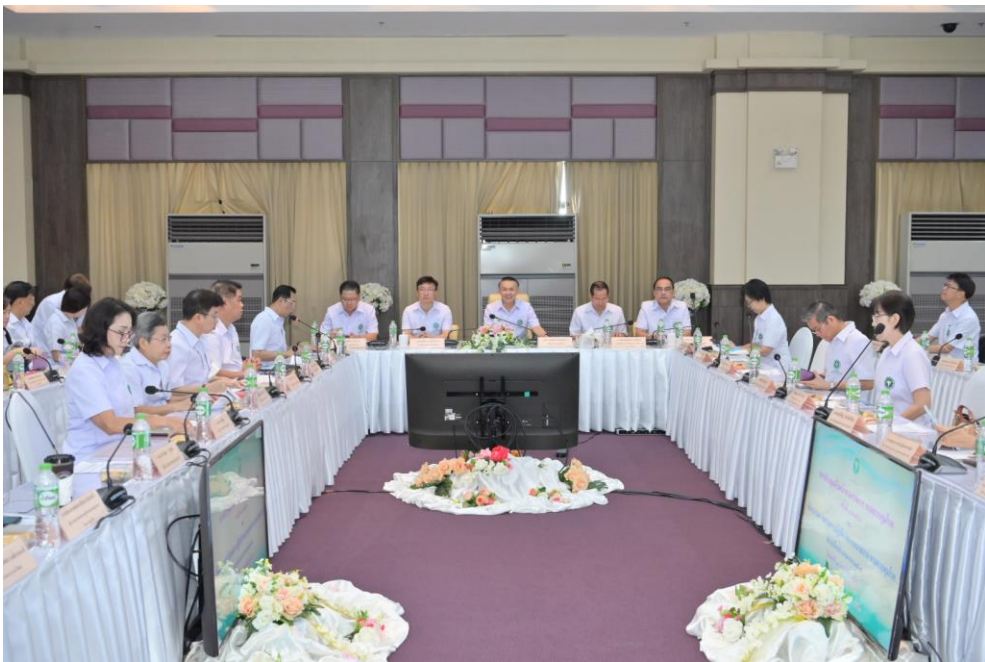
การสร้างวัฒนธรรม No Gift Policy กรมควบคุมโรค ประจำปีงบประมาณ พ.ศ. ๒๕๖๗