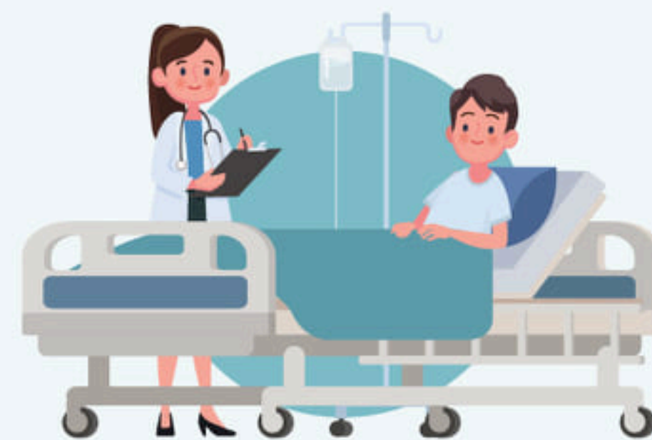
ผู้มีโรคเรื้อรัง ( ปอดอุดกั้นเรื้อรัง หอบหืด หัวใจ หลอดเลือดสมอง ไตวาย ผู้ป่วยมะเร็งที่อยู่ระหว่างการได้รับเคมีบำบัด และเบาหวาน )