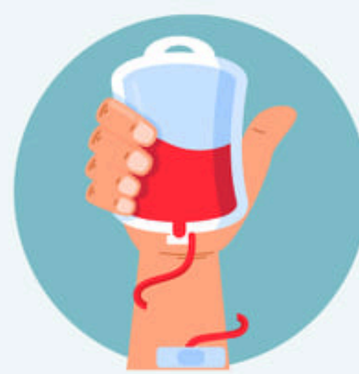
โรคธาลัสซีเมีย และผู้ที่มียูมิคุ้มกันบกพร่อง (รวมผู้ติดเชื้อ HIV ที่มีอาการ)