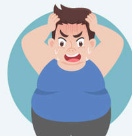
โรคอ้วน น้ำหนัก >100 กก. หรือ BMI >35 กก. ต่อ ตร.ม.