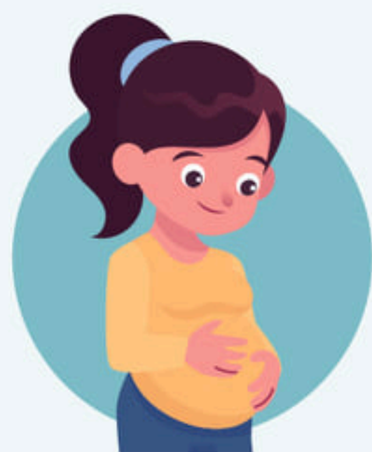
หญิงตั้งครรภ์ อายุครรภ์ 4 เดือนขึ้นไป