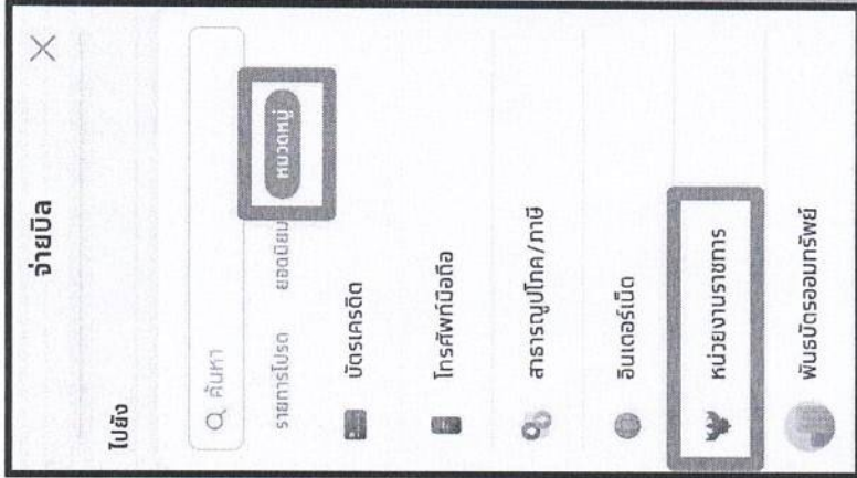
ขั้นตอนที่ 2