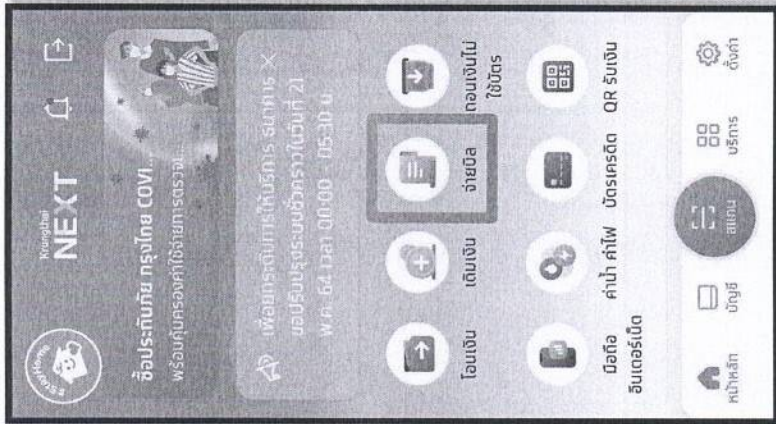
ขั้นตอนที่ 1