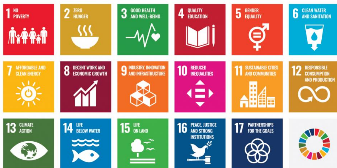
ภาพที่ ๓ - ๑ ภาพแสดงเป้าหมายการพัฒนาที่ยั่งยืน (Sustainable Development Goals : SDGs)

สำหรับเป้าหมายการพัฒนาที่ยั่งยืนที่เกี่ยวข้องกับสุขภาพและการป้องกันควบคุมภัยโรคติดต่อ ได้แก่ เป้าหมายการพัฒนาที่ยั่งยืนที่ ๓ สร้างหลักประกันว่าคนมีชีวิตที่มีสุขภาพดีและส่งเสริมสวัสดิภาพสำหรับทุกคนในทุกวัย (Ensure healthy lives and promote well-being for all at all ages) หรืออาจเรียกได้ว่าเป็นเป้าหมายด้านสุขภาพดี มีสวัสดิภาพ (Good health and well-being) ซึ่งครอบคลุมประเด็นด้านสุขภาพและสวัสดิภาพ ที่สำคัญหลายประเด็น มีประเด็นที่เกี่ยวข้องกับการป้องกันควบคุม กำจัด กวาดล้างโรคติดต่อ และการจัดการความเสี่ยงด้านสุขภาพ ได้แก่