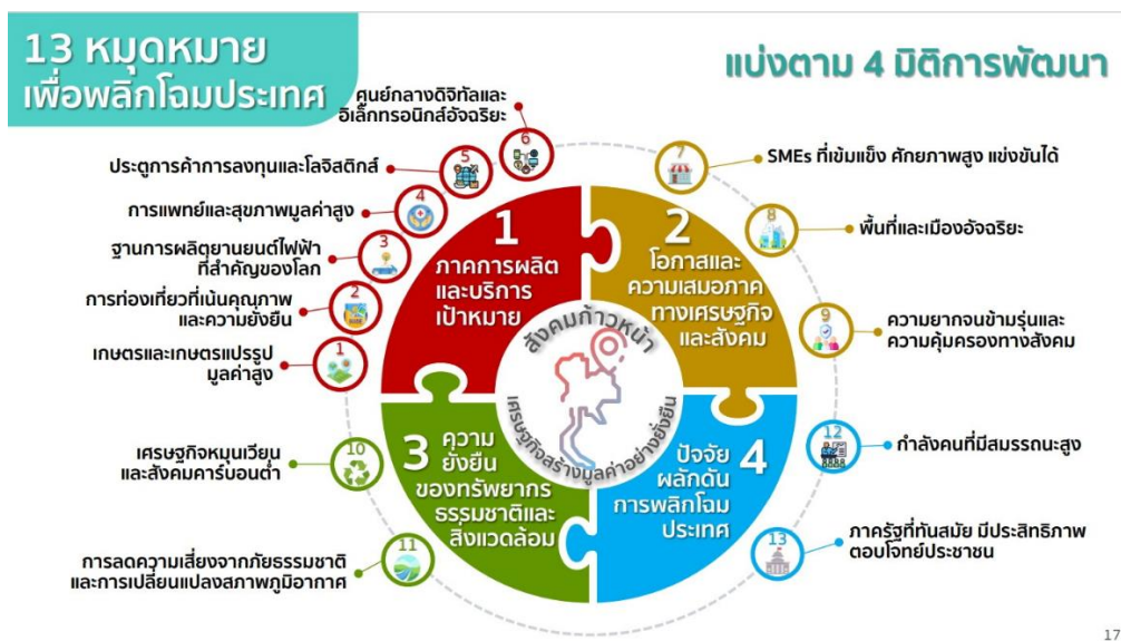
ภาพที่ ๒ - ๓ ภาพแสดงกรอบแผนพัฒนาเศรษฐกิจและสังคมแห่งชาติ ฉบับที่ ๑๓

สำนักงานสภาพัฒนาการเศรษฐกิจและสังคมแห่งชาติ จึงได้ดำเนินการจัดทำแผนพัฒนาเศรษฐกิจและสังคมแห่งชาติ ฉบับที่ ๑๓ ให้เป็นแผนที่มีความชัดเจนในการกำหนดทิศทางและเป้าหมายการพัฒนาประเทศที่ต้องการมุ่งเน้น โดยเริ่มต้นจากการสังเคราะห์ วิเคราะห์ แนวโน้ม พร้อมทั้งผลกระทบจากการเปลี่ยนแปลงที่อาจเกิดขึ้นทั้งภายในประเทศ ภูมิภาค และระดับโลก เพื่อประเมินความท้าทายและโอกาสในการพัฒนาประเทศภายใต้บริบทเงื่อนไข ข้อจำกัดที่ประเทศไทยต้องเผชิญอันเนื่องมาจากการเปลี่ยนแปลงดังกล่าว โดยพิจารณาองค์ประกอบของการพัฒนาประเทศในมิติด้านต่างๆ ที่มีความเชื่อมโยงหรือเป็นองค์ประกอบของประเด็นยุทธศาสตร์ที่ระบุไว้ในยุทธศาสตร์ชาติอย่างรอบด้าน ก่อนนำมาสู่การกำหนดจุดเน้นเชิงเป้าหมายที่ประเทศไทยต้องให้ความสำคัญและมุ่งเน้นดำเนินงานให้บรรลุผลในระยะของแผนพัฒนาฯ เพื่อให้ประเทศพร้อมเติบโตอย่างยั่งยืนและสามารถบรรลุเป้าหมายการพัฒนาประเทศภายใต้ยุทธศาสตร์ชาติได้อย่างสัมฤทธิ์ผล