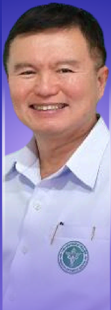
พ.ว.ภาณุมาศ ญาณเวทย์สกุล อธิบดีกรมควบคุมโรค