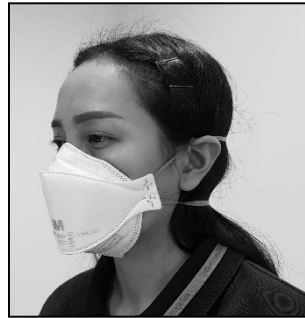
ภาพที่ ๖.๔ หน้ากาก N๙๕