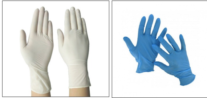
ภาพที่ ๖.๗ อุปกรณ์ป้องกันมือและแขน