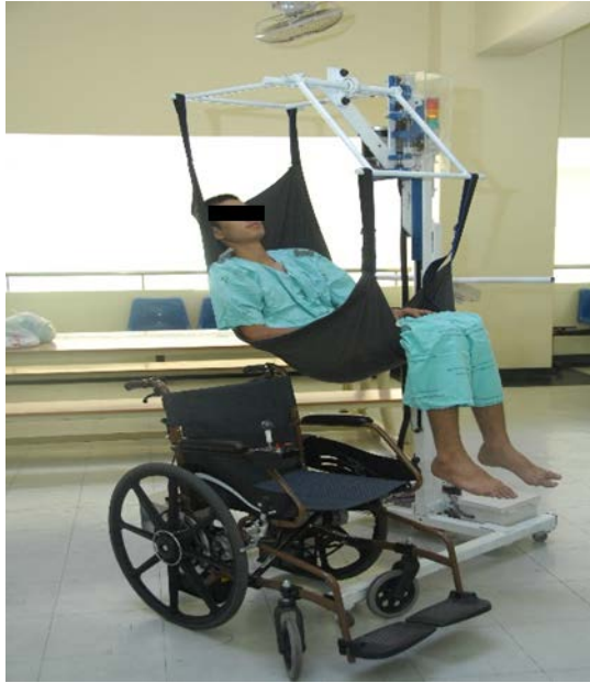
ภาพที่ ๓.๒. ตัวอย่างอุปกรณ์ช่วยยกผู้ป่วย