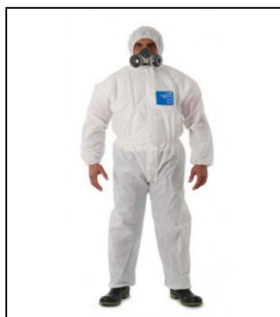
ภาพที่ ๖.๘ อุปกรณ์ปกป้องลำตัว

ใช้สำหรับป้องกันไม่ให้ผิวหนังของร่างกายได้รับอันตรายจากสารเคมี ทั้งจากการดูดซึมผ่านและการเกิดปฏิกิริยาเฉพาะที่ เช่น ไหม้ บวม คัน เป็นแผล เป็นต้น