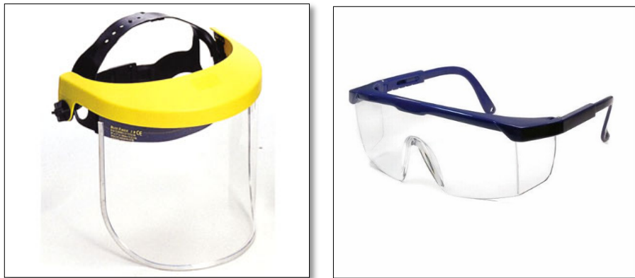
ภาพที่ ๖.๒ อุปกรณ์ปกป้องใบหน้าและดวงตา

เป็นอุปกรณ์สำหรับปกป้องใบหน้าและดวงตาจากการกระแทกกระแทกจากของแข็ง การกระเด็นของของเหลว สารคัดหลั่งจากคนไข้ ความระคายเคืองจากอนุภาค ก๊าซ และไอระเหยของสารเคมีที่ปนเปื้อนในบรรยากาศ และอันตรายจากแสงจ้าและรังสี