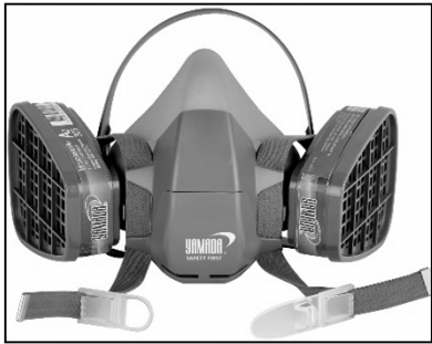
ภาพที่ ๖.๓ หน้ากากชนิดมีไส้กรองก๊าซและไอระเหย

หน้ากากกรองอนุภาคตามมาตรฐานของประเทศสหรัฐอเมริกา จะยึดเกณฑ์ตามมาตรฐาน ๔๒CFR Part ๘๔ ซึ่งตามมาตรฐานนี้ หน้ากากกรองอนุภาคที่ผ่านมาตรฐานจะได้รับการรับรองจาก NIOSH และ Department of Health and Human Services : DHHS ซึ่งสามารถแบ่งได้เป็น ๙ ประเภทด้วยกัน โดยจะแบ่งตามประสิทธิภาพการกรอง (๙๕% ๙๙% และ ๙๙.๙๗%) และชนิดของไส้กรอง (N, R and P) ซึ่งทั้งหมดใช้อนุภาคขนาดเดียวกัน คือ ๐.๓ micrometers