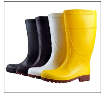
ภาพที่ ๖.๙ อุปกรณ์ปกป้องเท้า