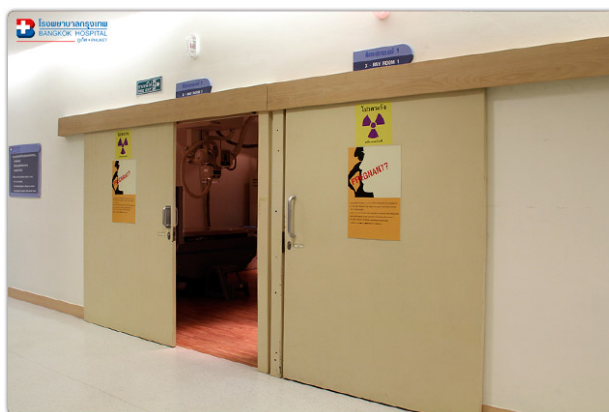
ภาพที่ ๒.๒ ตัวอย่างรังสีที่ก่อให้เกิดการแตกตัว ห้องเอกซเรย์

รังสีที่ก่อให้เกิดการแตกตัวได้ถูกนำมาใช้ในโรงพยาบาลในรูปแบบที่แตกต่างกัน เช่น รังสีเอกซ์ หรือรังสีแกมมา ทั้งนี้ขึ้นอยู่กับวัตถุประสงค์ของการนำมาใช้งาน ได้แก่ การวินิจฉัยโรค การรักษาโรคต่าง ๆ การเตรียมยาและผลิตยา