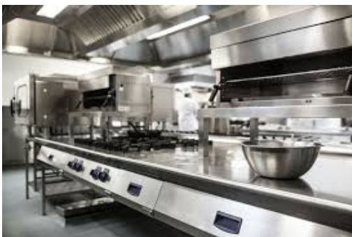
ภาพที่ ๒.๑ ตัวอย่างแหล่งกำเนิดความร้อนในแผนกโภชนาการ

๑) แผนกที่พบ เช่น โรงซักฟอก ห้องติดตั้งหม้อไอน้ำ งานโภชนาการ แผนกซักฟอก ฯลฯ