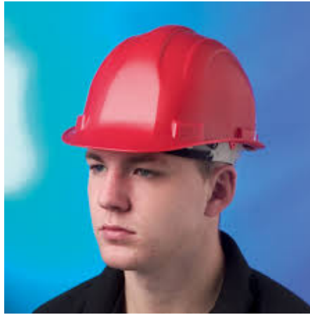
ภาพที่ ๖.๑ อุปกรณ์ป้องกันศีรษะ

เป็นอุปกรณ์สำหรับป้องกันอันตรายจากการกระแทก การเจาะทะลุของวัตถุที่มากระทบศีรษะหรืออันตรายจากไฟฟ้า ทำจากวัสดุที่แข็ง เหนียว และทนทาน