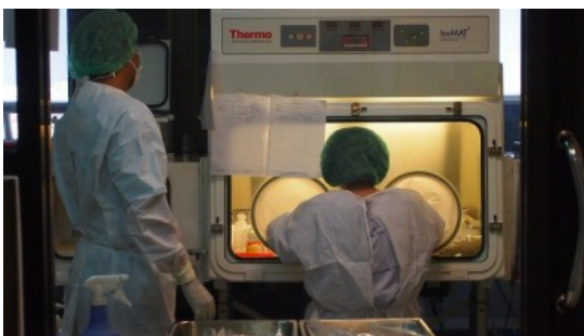
ภาพที่ ๒.๓ การทำงานกับสารเคมีในห้องผสมยาเคมีบำบัด

๒.๓.๑ แผนกที่พบ สามารถพบได้เกือบทุกแผนก เช่น ห้องปฏิบัติการ ห้องผสมยา ห้องเคมีบำบัด แผนก ซักฟอก ซ่อมบำรุง และแผนกอื่น ๆ ที่มีการใช้สารเคมีในขั้นตอนการทำงานต่าง ๆ