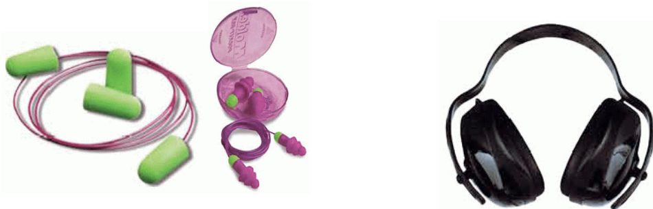
ภาพที่ ๖.๖ Ear plugs และ Ear muff

๑) ที่อุดหู (ear plugs) เป็นอุปกรณ์ที่สอดไว้ในช่องหูเพื่อกั้นทางเดินเสียงและดูดซับเสียง ลดเสียงได้ตั้งแต่ ๒๕-๑๕ dB ลดเสียงที่มีความถี่ต่ำกว่า ๔๐๐ Hz ได้ดี มักทำมาจากยางสังเคราะห์ที่อ่อนนุ่มหรือโฟม จึงสวมใส่ได้โดยไม่รู้สึกรัดในช่องหู สิ่งที่ต้องระวัง คือ ไม่ควรใช้ที่อุดหู หากภายในช่องหูมีบาดแผล ผู้ใช้ควรฝึกการสวมใส่ให้ถูกต้องเพื่อให้ได้ประสิทธิภาพในการลดเสียงอย่างเต็มที่