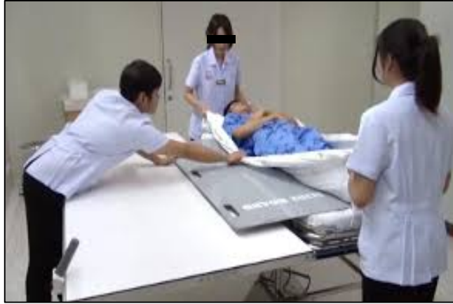
ภาพที่ ๒.๔ ตัวอย่างท่าทางการทำงานที่ผิดปกติ หรือเป็นธรรมชาติจากการเคลื่อนย้ายผู้ป่วย