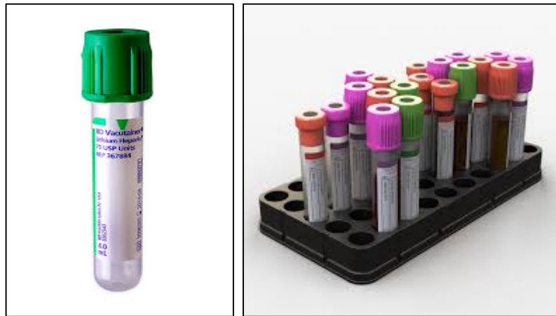
ภาพที่ ๕.๑ Vacutainer tube

๕) กรณีไม่สามารถนำส่งห้องปฏิบัติการได้ในทันที ให้เก็บรักษาตัวอย่างไว้ในตู้เย็นที่อุณหภูมิ ๒-๘ องศาเซลเซียส (ช่องธรรมดา)