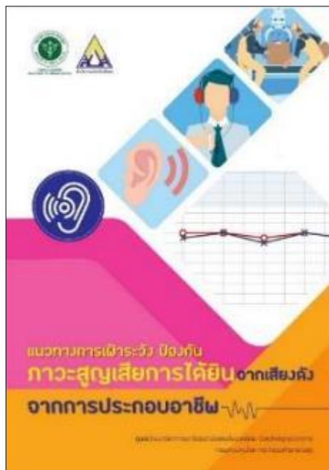
ภาพที่ ๔.๓ ..แนวทางการเฝ้าระวัง ป้องกัน ภาวะสูญเสียการได้ยินจากเสียงดังจากการประกอบอาชีพ

๓. แนวทางการเฝ้าระวัง ป้องกันภาวะสูญเสียการได้ยินจากเสียงดังจากการประกอบอาชีพ รูปแบบ digital จำนวน ๑ เรื่อง โดยมีวัตถุประสงค์เพื่อเป็นแนวทางใช้เครื่องมือทางด้านอาชีวสุขศาสตร์ ในการประเมินสภาพแวดล้อมการทำงาน และเครื่องมืออาชีวเวชศาสตร์ในการตรวจสอบสุขภาพตามปัจจัยเสี่ยง จากการทำงานสำหรับ แพทย์ พยาบาล นักวิชาการ หรือผู้ที่เกี่ยวข้องสามารถนำไปใช้ในการดำเนินงาน จัดบริการอาชีวอนามัย เพื่อเฝ้าระวังสุขภาพผู้ที่มีความเสี่ยงที่จะเกิดการสูญเสียการได้ยินจากการสัมผัส เสียงดังจากการประกอบอาชีพจำนวน ๑ เรื่อง