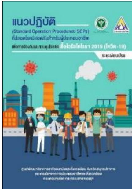
ภาพที่ ๔.๒ แนวปฏิบัติที่ปลอดภัยสำหรับ ผู้ประกอบอาชีพเพื่อการป้องกัน และควบคุมโรคติดเชื้อไวรัสโคโรนา ๒๐๑๙ (โควิด-๑๙) ระยะผ่อนปรน

๓. แนวทางการเฝ้าระวัง ป้องกันภาวะสูญเสียการได้ยินจากเสียงดังจากการประกอบอาชีพ รูปแบบ digital จำนวน ๑ เรื่อง โดยมีวัตถุประสงค์เพื่อเป็นแนวทางใช้เครื่องมือทางด้านอาชีวสุขศาสตร์ ในการประเมินสภาพแวดล้อมการทำงาน และเครื่องมืออาชีวเวชศาสตร์ในการตรวจสอบสุขภาพตามปัจจัยเสี่ยง จากการทำงานสำหรับ แพทย์ พยาบาล นักวิชาการ หรือผู้ที่เกี่ยวข้องสามารถนำไปใช้ในการดำเนินงาน จัดบริการอาชีวอนามัย เพื่อเฝ้าระวังสุขภาพผู้ที่มีความเสี่ยงที่จะเกิดการสูญเสียการได้ยินจากการสัมผัส เสียงดังจากการประกอบอาชีพจำนวน ๑ เรื่อง