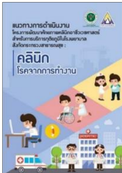
ภาพที่ ๔.๑ แนวทางการดำเนินงานโครงการพัฒนาศักยภาพคลินิกอาชีวเวชศาสตร์

๑. แนวทางการดำเนินงานโครงการพัฒนาศักยภาพคลินิกอาชีวเวชศาสตร์สำหรับการบริการ ทุติยภูมิในโรงพยาบาลสังกัดกระทรวงสาธารณสุข : คลินิกโรคจากการทำงาน ปี ๒๕๖๓ โดยมีวัตถุประสงค์ เพื่อเป็นแนวทาง สร้างความรู้ความเข้าใจแก่ผู้ปฏิบัติงานของโรงพยาบาลที่เข้าร่วมโครงการ ให้สามารถ ดำเนินโครงการไปในทิศทางเดียวกัน โดยเฉพาะเรื่องการทำตามตัวชี้วัดของโครงการ การรายงาน ผลการดำเนินงานทั้งรายงานรายสัปดาห์ และรายงานฉบับสมบูรณ์ การใช้จ่ายเงิน การจัดทำข้อเสนอ โครงการเพื่อรับเงินจัดสรรรายปี ฯลฯ โดยแนวทางดังกล่าวพัฒนาจากการทบทวนเอกสารทางวิชาการ ข้อคิดเห็นจากผู้เชี่ยวชาญโดยจัดพิมพ์ จำนวน ๒๐๐ เล่ม