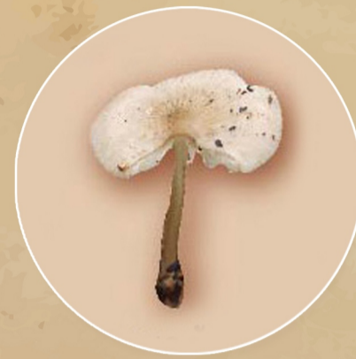
เห็ดตอม กล้วยแห้ง