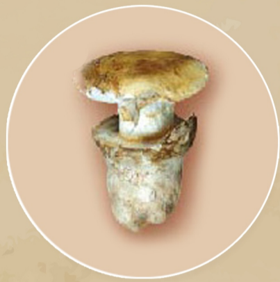
เห็ดระโงกเหลือง ก้านตัน