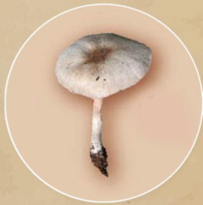
เห็ดคล้ายเห็ดโคน