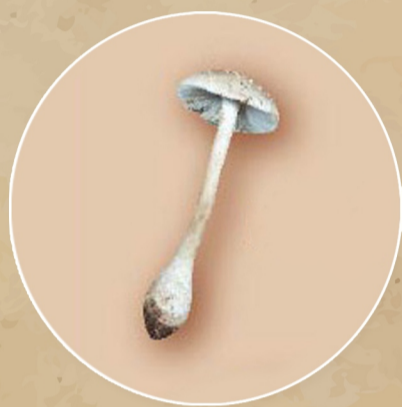
เห็ดดอกกระถิน