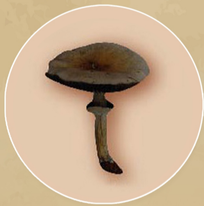
เห็ดขี้วัว