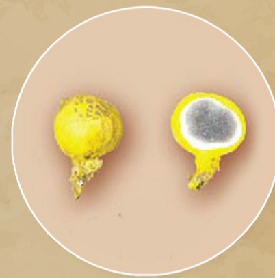
เห็ดไข่หงษ์