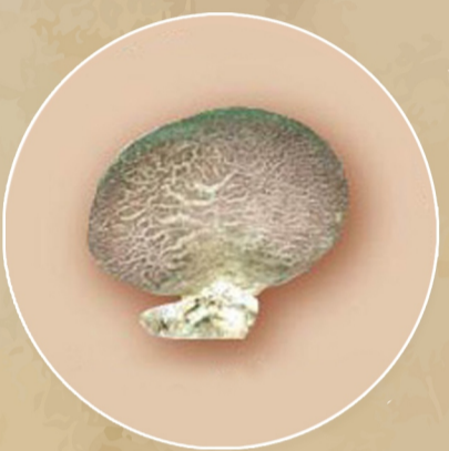
เห็ดเผาะ(มีราก)