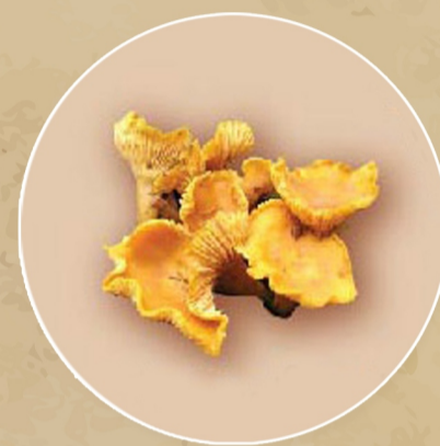
เห็ดมันปูใหญ่