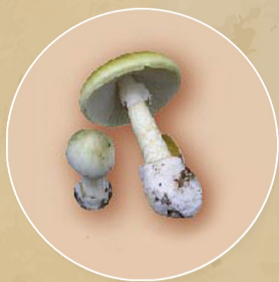
เห็ดระโงกหิน