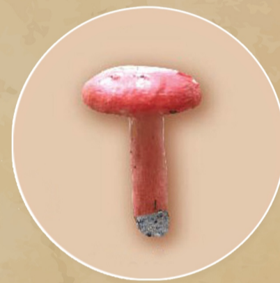
เห็ดแดงก้านแดง