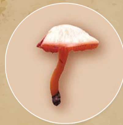
เห็ดโคนส้ม