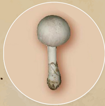
เห็ดกระโดน ตีนตัน