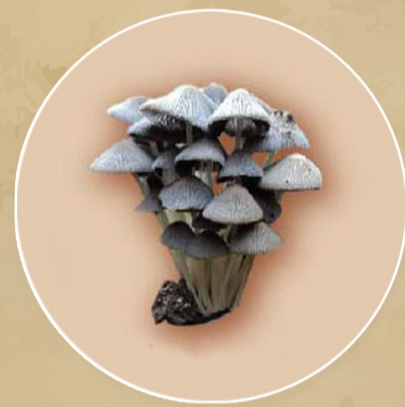
เห็ดขี้ควาย