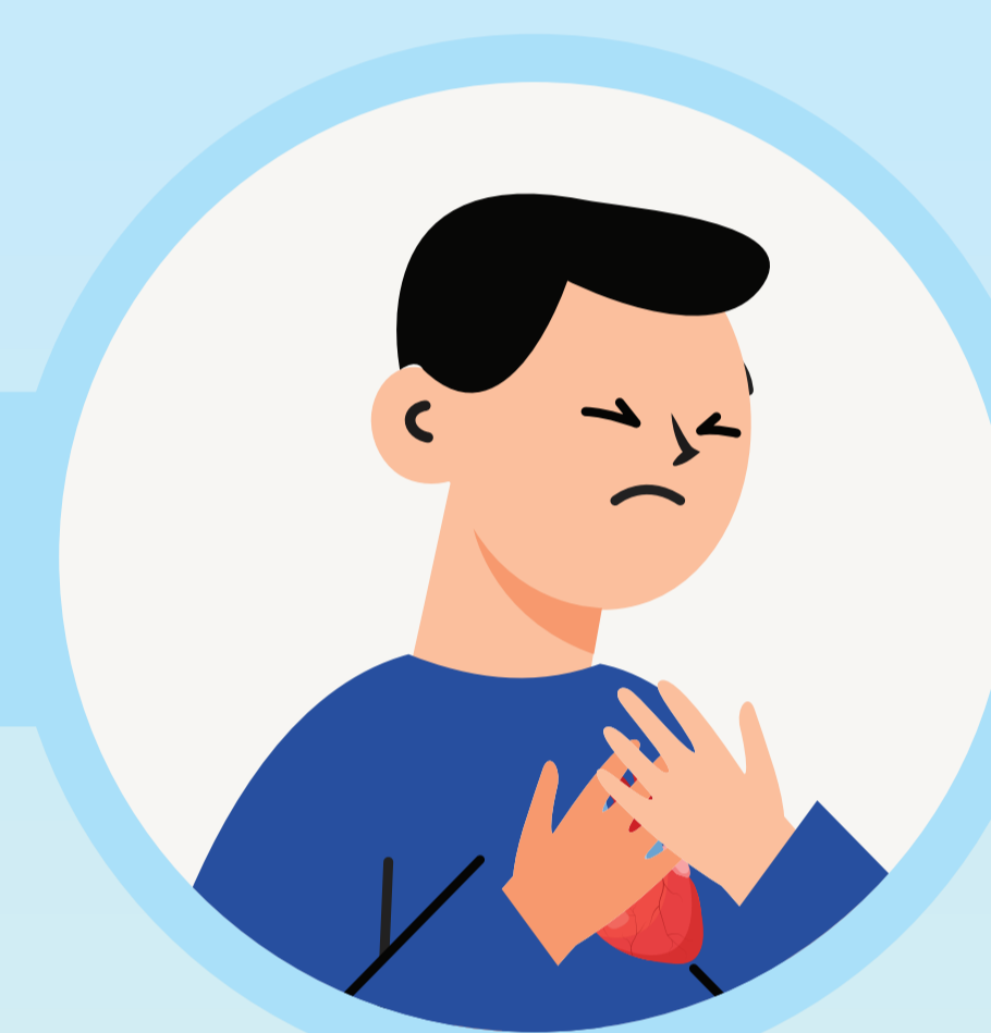
เจ็บหน้าอก หายใจไม่สะดวก