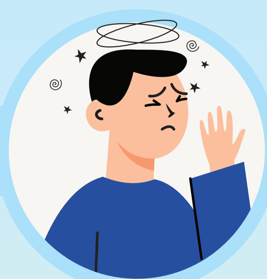
ปวดหัว วิงเวียนหน้ามืด