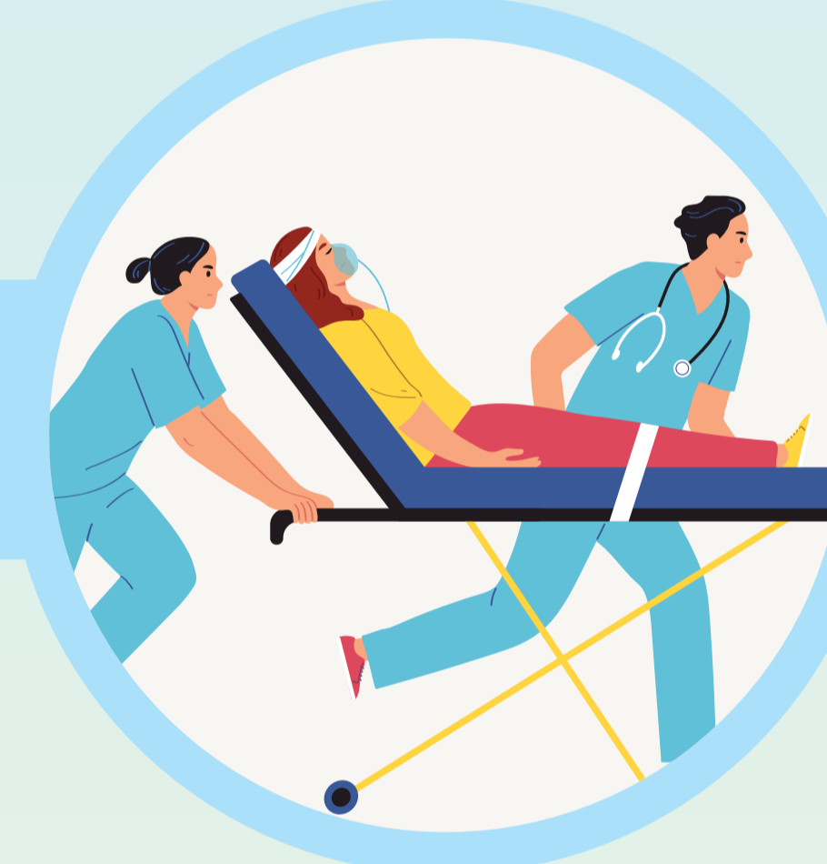
หมดสติ และเสียชีวิต