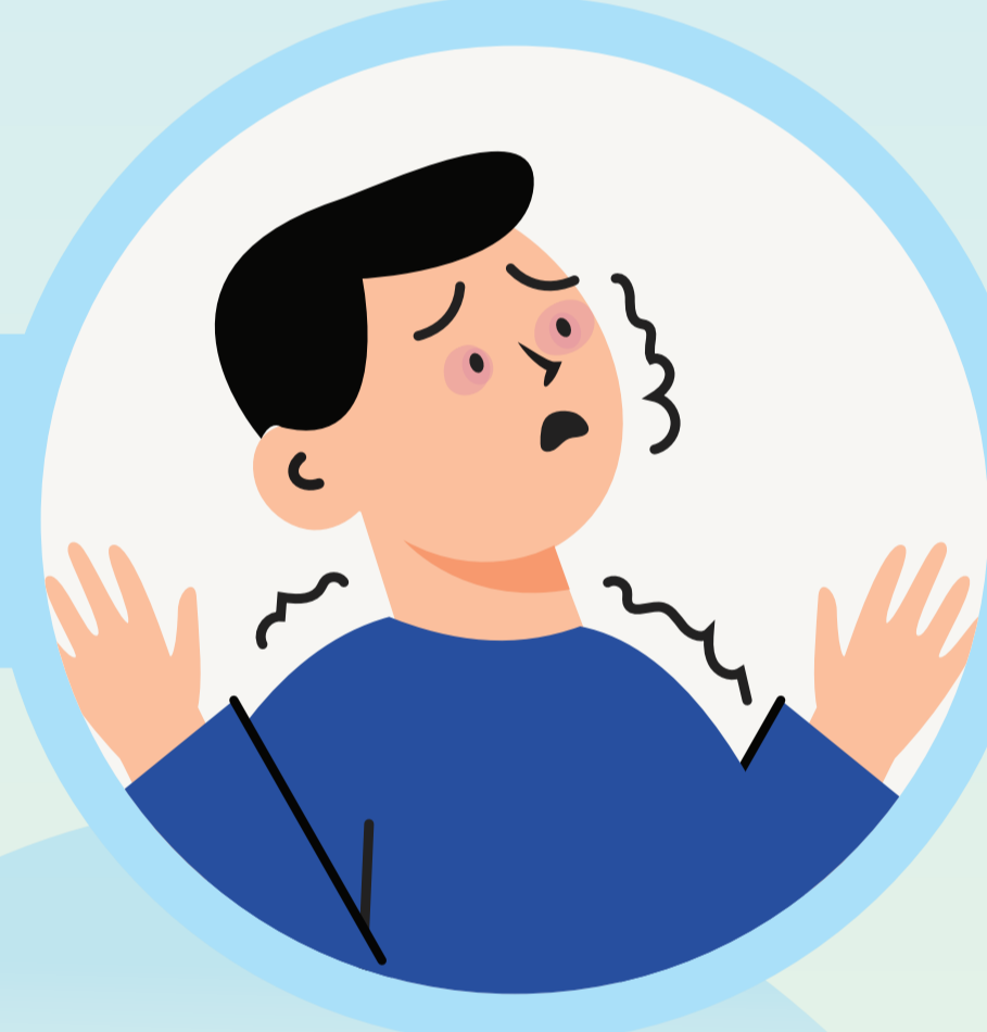
ชักเกร็ง ตาพร่ามัว