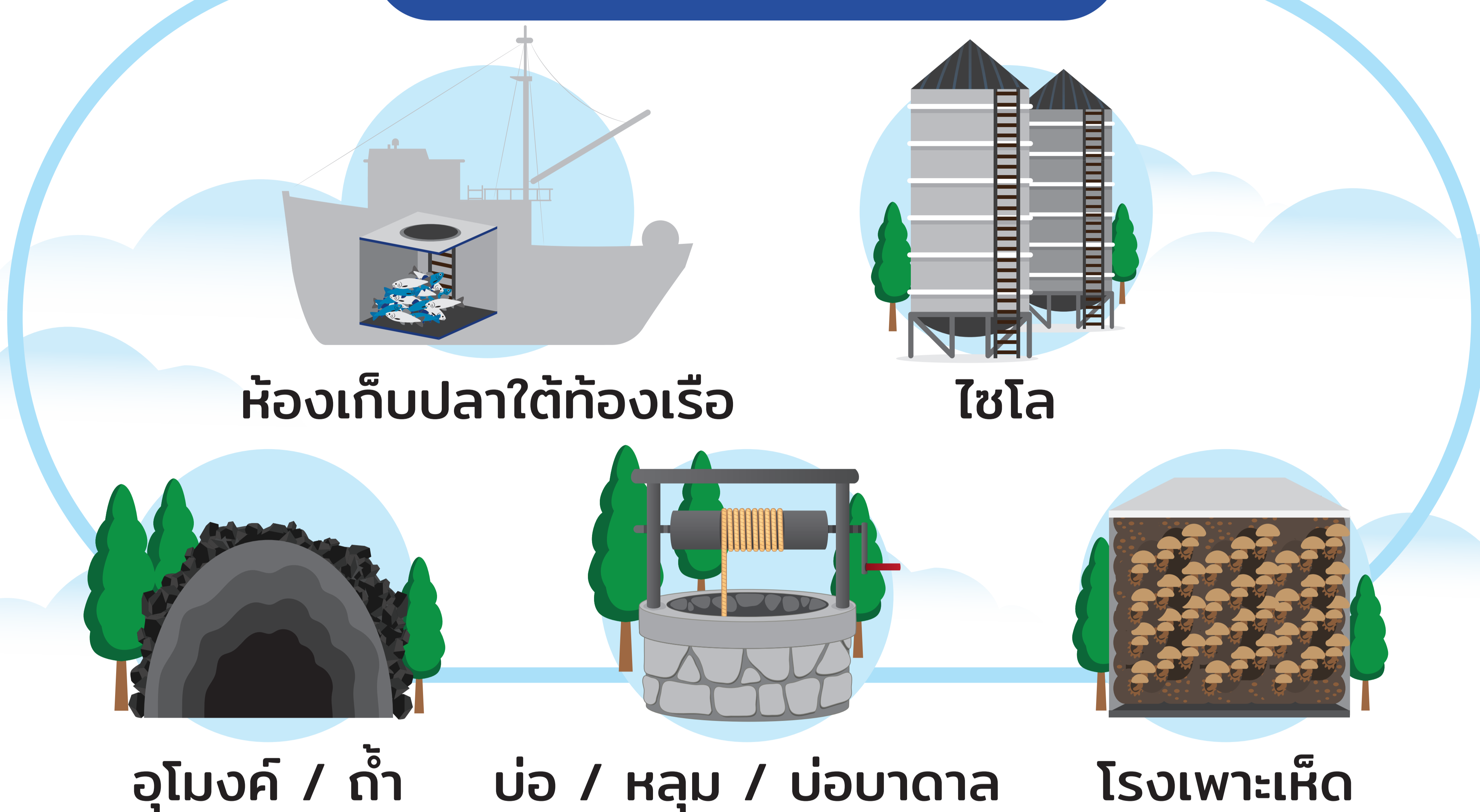
ห้องเก็บปลาใต้ท้องเรือ