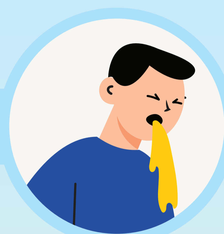
คลื่นไส้ อาเจียน