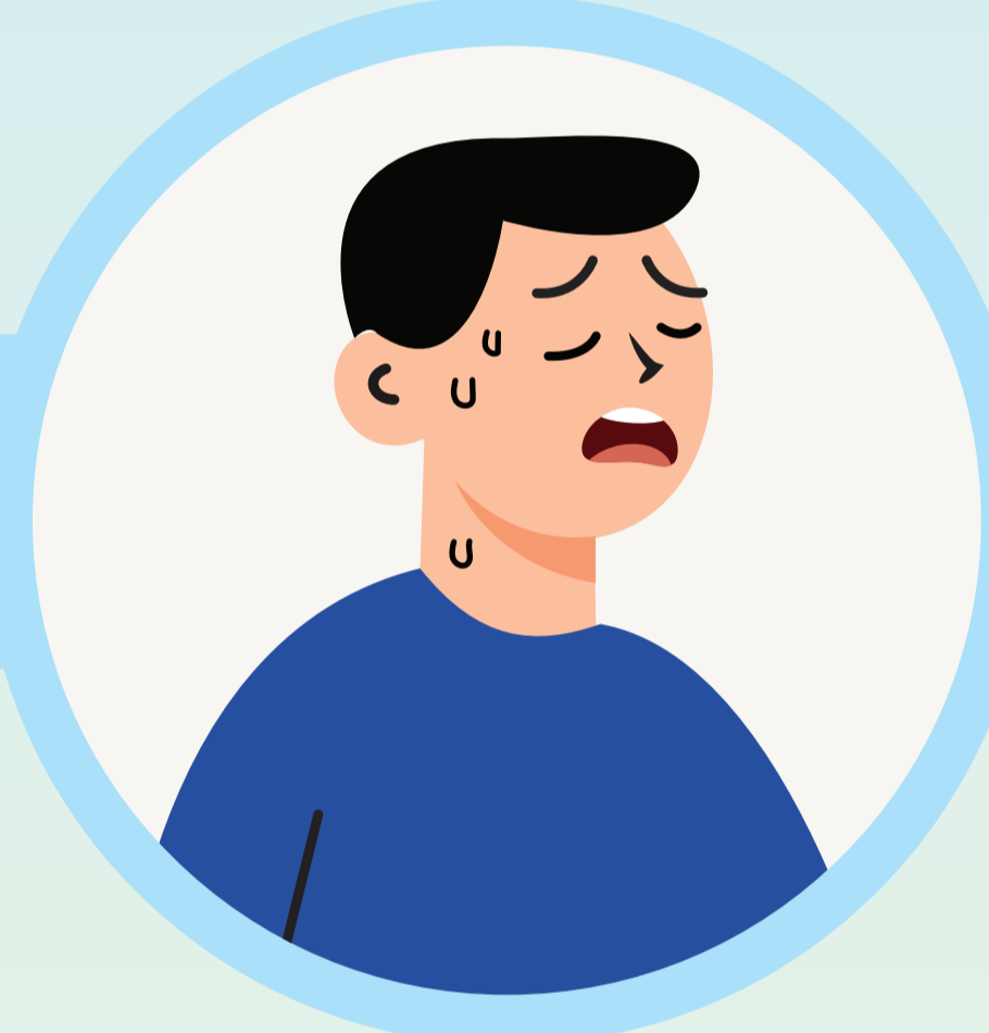
เหนื่อยเพลีย อ่อนแรง