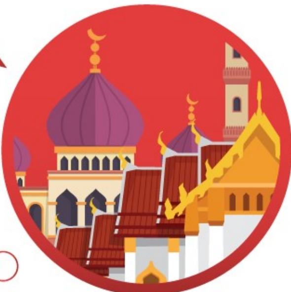
กิจกรรมทางศาสนา