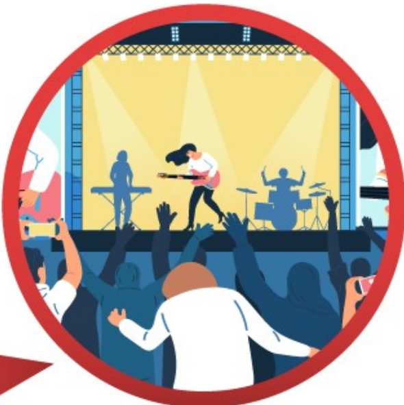
งานคอนเสิร์ต