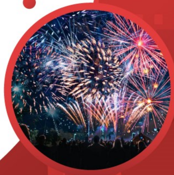
งานฉลอง เช่น สงกรานต์ ปีใหม่ ลอยกระทง ฯลฯ