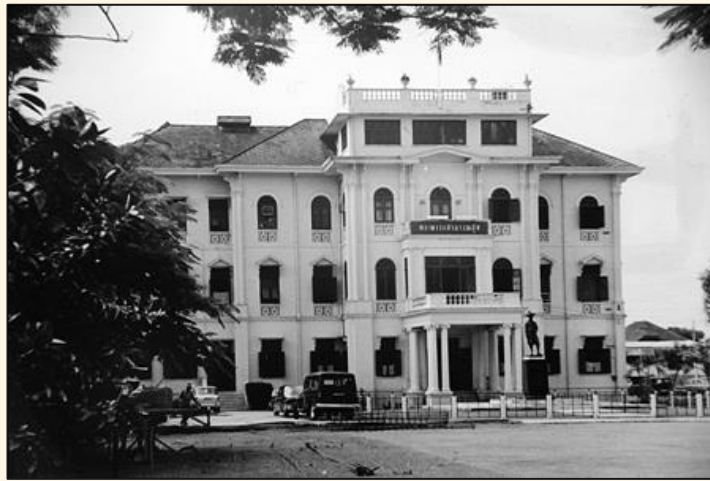
กระทรวงสาธารณสุข วังเทวะเวสม์

จากการทำงานด้านสาธารณสุขที่กระจัดกระจาย ข้ำซ้อน และขาดการติดต่อประสานงานกันระหว่างหน่วยงาน พระบาทสมเด็จพระมงกุฎเกล้าเจ้าอยู่หัวทรงดำริให้รวมงานด้านสาธารณสุขที่กระจายกันอยู่ในหลายหน่วยงานให้รวมกันอยู่เป็นหน่วยงานเดียวกัน และในวันที่ 27 พฤศจิกายน พ.ศ. 2461 ได้มีการปรับเปลี่ยนจากกรมประชาภิบาลเป็น “กรมสาธารณสุข” และทรงพระกรุณาโปรดเกล้าฯ ให้ “พระเจ้าน้องยาเธอกรมหมื่นชัยนาทนเรนทร” เป็นอธิบดีกรมสาธารณสุขคนแรกและอยู่ภายใต้สังกัดกระทรวงมหาดไทย แม้ในช่วงแรกจะมีปัญหาและอุปสรรคหลายอย่าง ทั้งในเรื่องการแบ่งงาน การโอนย้ายความรับผิดชอบ และอื่น ๆ แต่อย่างไรก็ดี ปัญหาต่าง ๆ ก็ได้รับการแก้ไขและสามารถดำเนินกิจการสาธารณสุข โดยยึดหลัก “การป้องกันดีกว่าการแก้” มีการส่งเสริมการป้องกันโรค ส่งเสริมเรื่องความรู้ด้านสุขอนามัย มีการปราบปรามโรคระบาดที่เป็นปัญหาหลักด้านสุขภาพ เช่น ไข้ทรพิษ อหิวาตกโรค และกาฬโรค มีการควบคุมโรคเรื้อน โรคคุดทะราด ตลอดจนทำความร่วมมือกันองค์กรต่างประเทศ เช่น มูลนิธิโรคกีฬเลอริในการรณรงค์กำจัดโรคพยาธิปากขอ นอกจากนี้ยังมีการขยายงานด้านมารดา ทารกสงเคราะห์ จัดการสุขศึกษาอย่างกว้างขวาง รวมทั้งยังมีการส่งคนไปศึกษาต่อยังต่างประเทศ สิ่งเหล่านี้ นับว่าการเกิดขึ้นของกรมสาธารณสุขเป็นจุดเริ่มต้นของการสาธารณสุขยุคใหม่อย่างแท้จริง