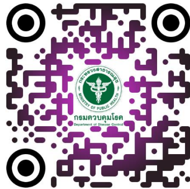
2) สมาคมผู้ให้ความรู้โรคเบาหวาน