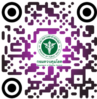
3) สมาคมความดันโลหิตสูงแห่งประเทศไทย