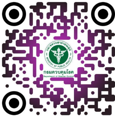
1) สมาคมโรคเบาหวานแห่งประเทศไทยฯ