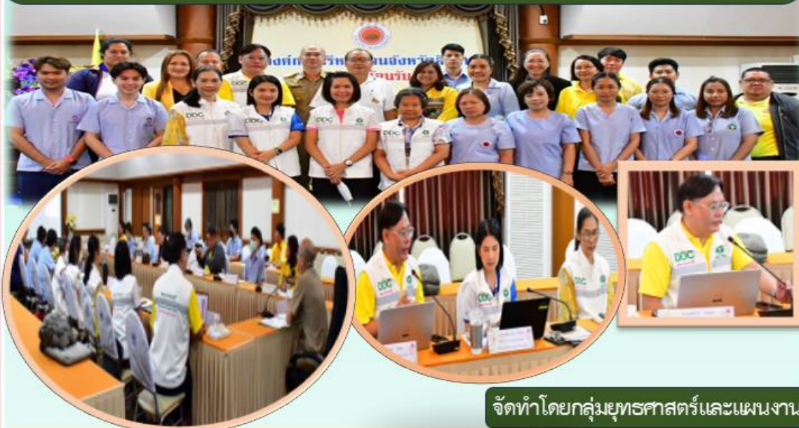
จัดทำโดยกลุ่มยุทธศาสตร์และแผนงาน

ประชุมราชการชี้แจงแนวทางการพัฒนาระบบการป้องกันควบคุมโรค และภัยสุขภาพให้กับ รพ.สต. ที่ถ่ายโอนภารกิจไปยัง อบจ. วันพุธที่ ๒๗ พฤศจิกายน ๒๕๖๗ ณ ห้องประชุมองค์การบริหารส่วนจังหวัดสิงห์บุรี