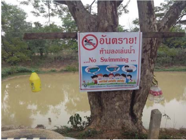
การจัดการแหล่งน้ำเสี่ยง