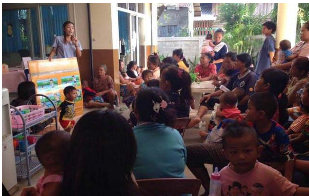
การให้ความรู้