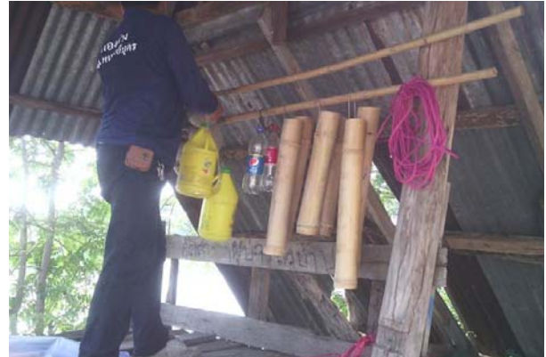
การจัดการแหล่งน้ำเสี่ยง