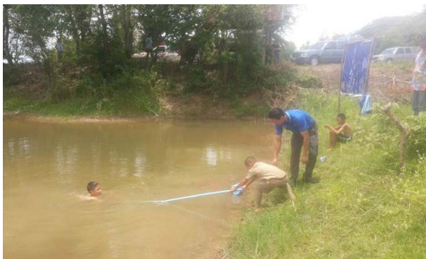
การสอนหลักสูตรว่ายน้ำเพื่อชีวิตรอด