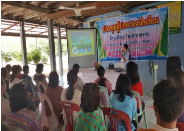
การให้ความรู้