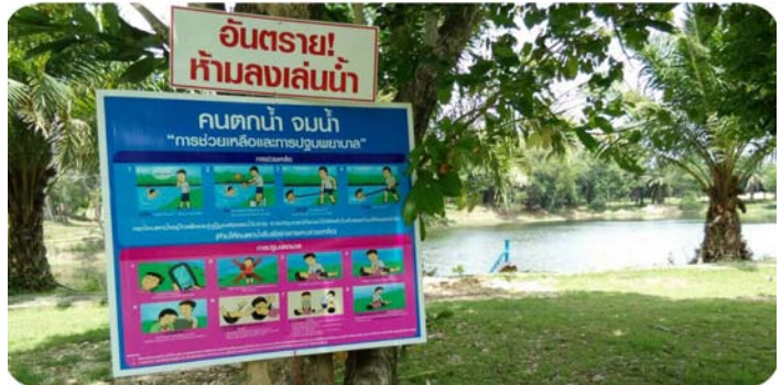
การจัดการแหล่งน้ำเสี่ยง