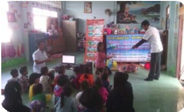
การดำเนินการในศูนย์พัฒนาเด็กเล็ก