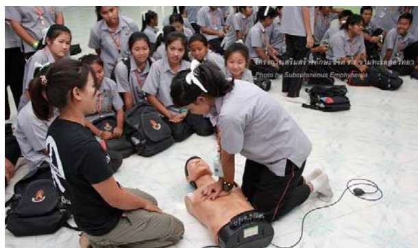
การฝึกปฏิบัติการช่วยฟื้นคืนชีพ (CPR)