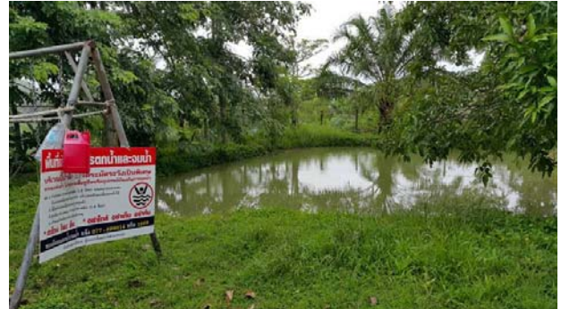
การจัดการแหล่งน้ำเสี่ยง