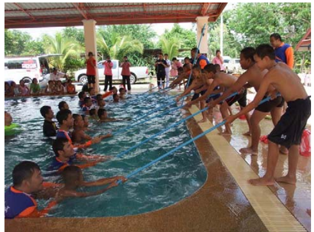
การสอนหลักสูตรว่ายน้ำเพื่อชีวิตรอด