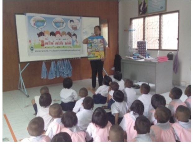
การดำเนินการในศูนย์พัฒนาเด็กเล็ก