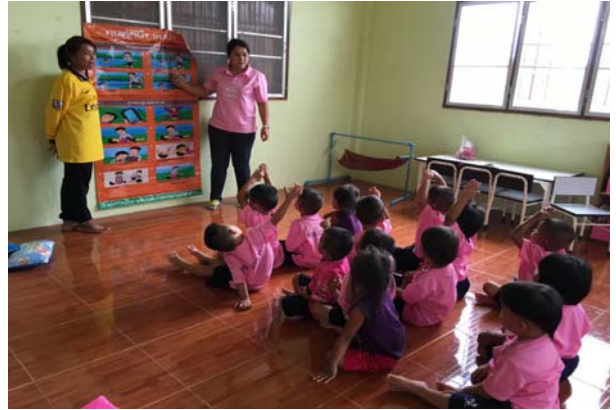
การดำเนินการในศูนย์พัฒนาเด็กเล็ก