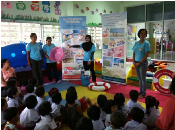
การดำเนินการในศูนย์พัฒนาเด็กเล็ก