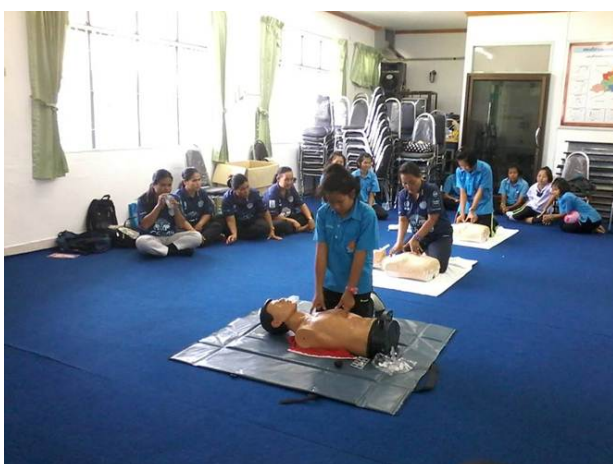
การฝึกปฏิบัติการช่วยฟื้นคืนชีพ (CPR)