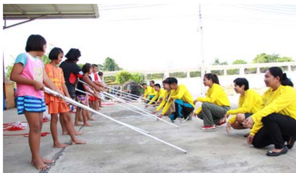
การสอนหลักสูตรว่ายน้ำเพื่อชีวิตรอด