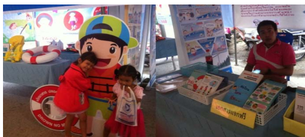
การสื่อสารประชาสัมพันธ์