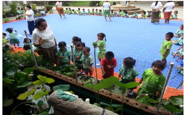
การดำเนินการในศูนย์พัฒนาเด็กเล็ก