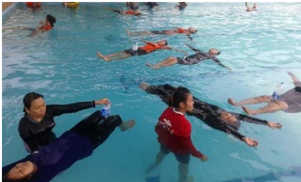
การสอนหลักสูตรว่ายน้ำเพื่อชีวิตรอด