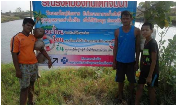
การจัดการแหล่งน้ำเสี่ยง