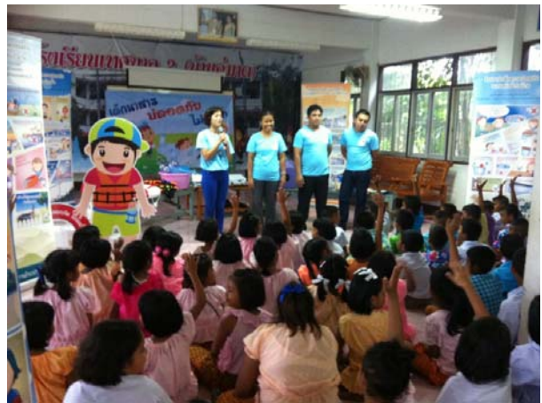
การให้ความรู้