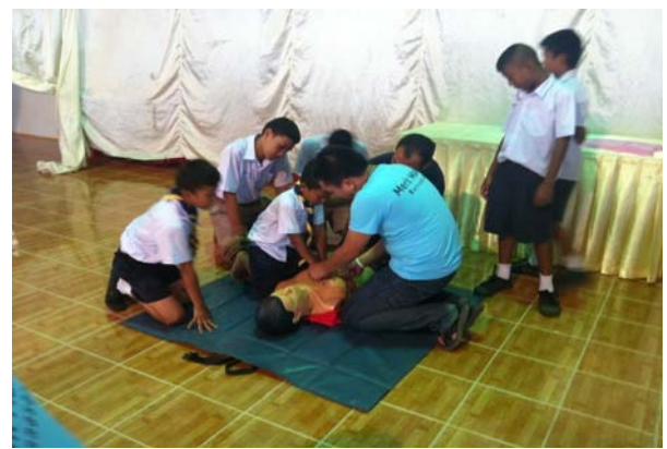
การฝึกปฏิบัติการช่วยฟื้นคืนชีพ (CPR)