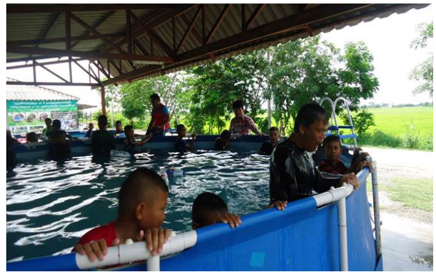
การสอนหลักสูตรว่ายน้ำเพื่อชีวิตรอด