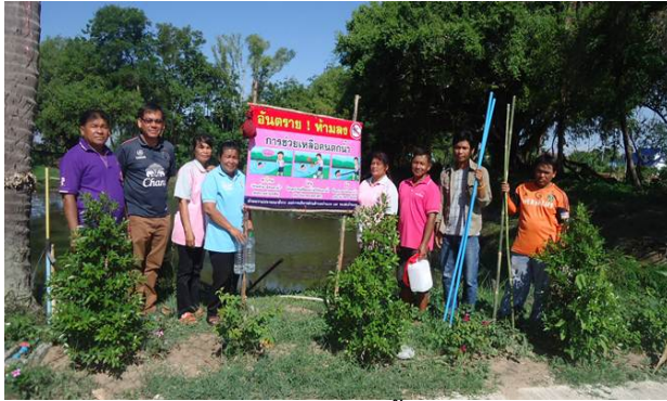
การจัดการแหล่งน้ำเสี่ยง