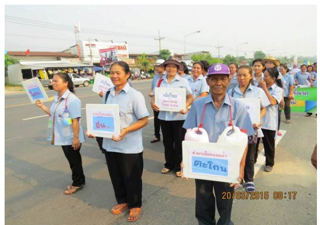
การสื่อสารประชาสัมพันธ์