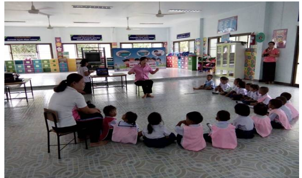
การดำเนินการในศูนย์พัฒนาเด็กเล็ก