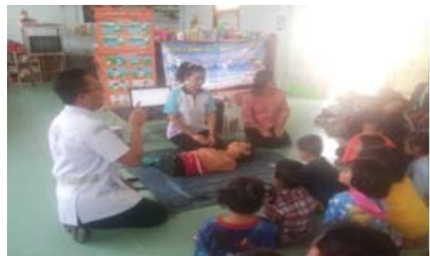
การฝึกปฏิบัติการช่วยฟื้นคืนชีพ (CPR)