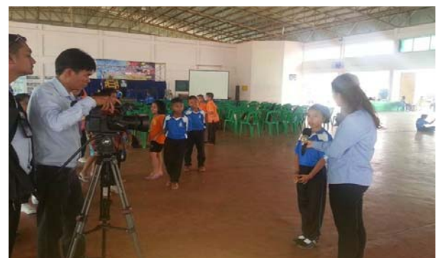
การสื่อสารประชาสัมพันธ์