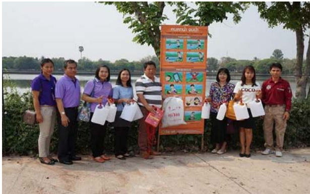
การจัดการแหล่งน้ำเสี่ยง