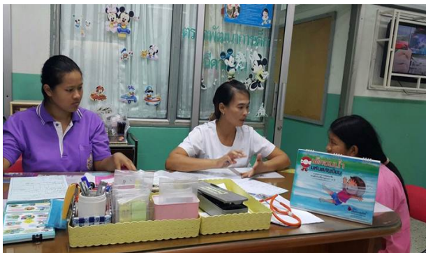
การให้ความรู้