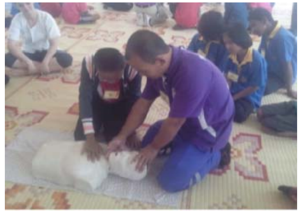
การฝึกปฏิบัติการช่วยฟื้นคืนชีพ (CPR)