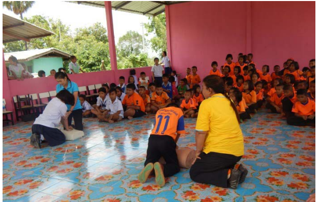
การฝึกปฏิบัติการช่วยฟื้นคืนชีพ (CPR)