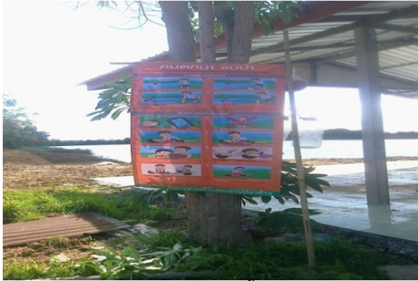
การจัดการแหล่งน้ำเสี่ยง