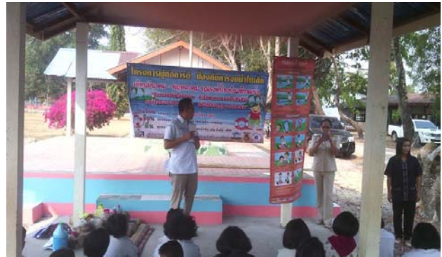
การให้ความรู้