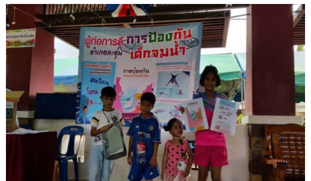
การสื่อสารประชาสัมพันธ์