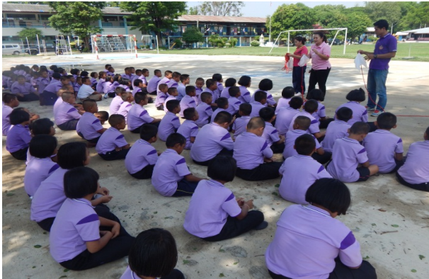
การให้ความรู้