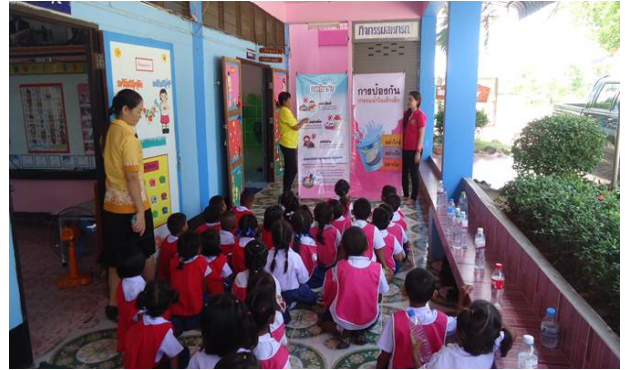
การดำเนินการในศูนย์พัฒนาเด็กเล็ก