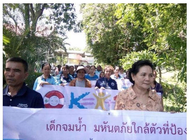
การสื่อสารประชาสัมพันธ์