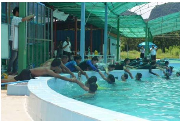
การสอนหลักสูตรว่ายน้ำเพื่อชีวิตรอด