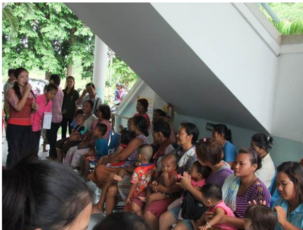
การให้ความรู้