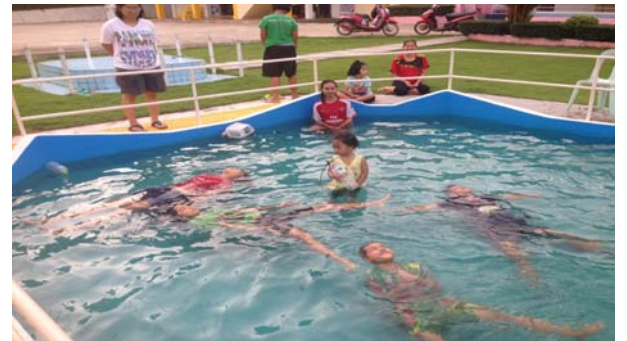
การสอนหลักสูตรว่ายน้ำเพื่อชีวิตรอด