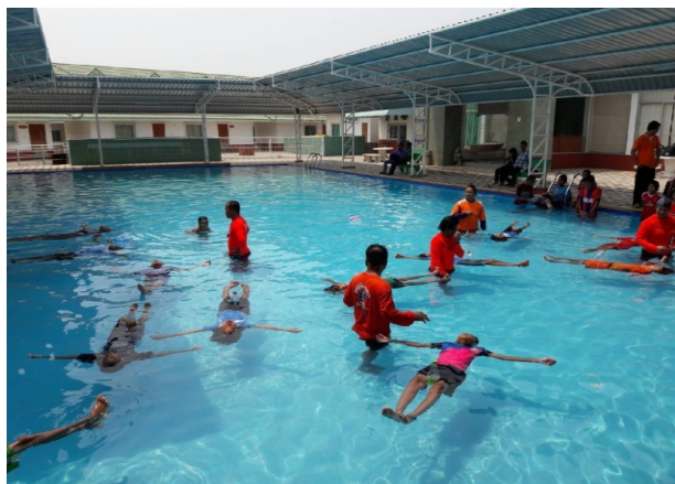
การสอนหลักสูตรว่ายน้ำเพื่อชีวิตรอด