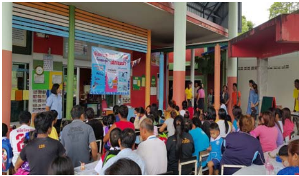
การดำเนินการในศูนย์พัฒนาเด็กเล็ก