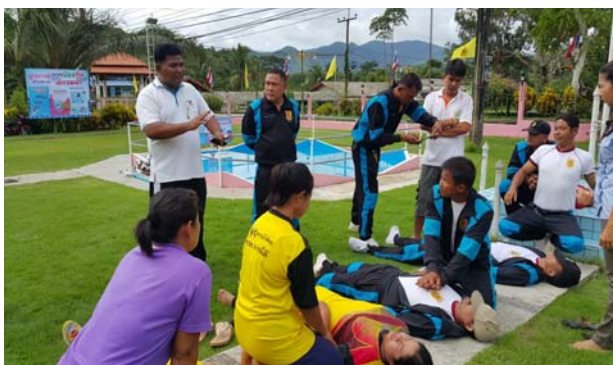
การฝึกปฏิบัติการช่วยฟื้นคืนชีพ (CPR)