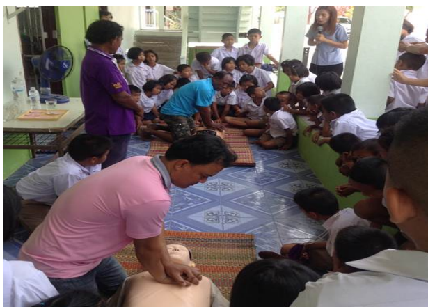
การฝึกปฏิบัติการช่วยฟื้นคืนชีพ (CPR)