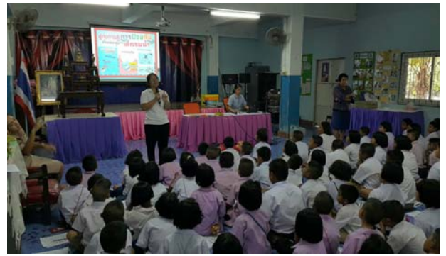
การให้ความรู้