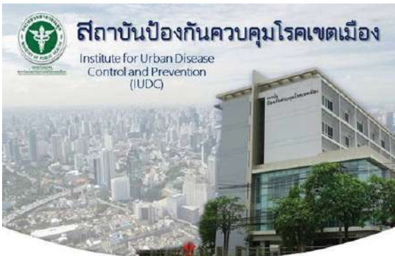
สถาบันป้องกันควบคุมโรคเขตเมือง เพื่อสุขภาพคนเมือง

หลายแห่ง จึงต้องมีระบบการจัดการที่ทันสมัย และอาศัยการระดมทรัพยากร บุคลากร องค์ความรู้ นวัตกรรมใหม่ๆ จากแหล่งต่างๆ มาผสมผสานให้เหมาะสมกับพื้นที่เขตเมือง