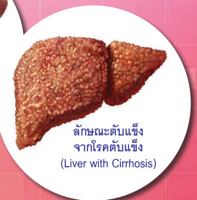
ลักษณะตับแข็งจากโรคตับแข็ง (Liver with Cirrhosis)

การป้องกันโรคไวรัสตับอักเสบบี นั้นสามารถทำได้ ดังนี้ 1. ใช้ถุงยางอนามัยทุกครั้งที่มีเพศสัมพันธ์ ซึ่งช่วยให้ปลอดภัยจากโรคติดต่อทางเพศสัมพันธ์ ทุกชนิด 2. ไม่ใช้เข็มฉีดยาร่วมกัน 3. หลีกเลี่ยง