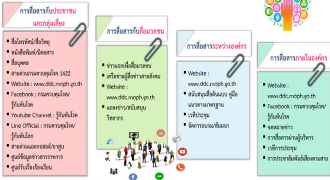
แผนภาพที่ 7 การเปิดเผยข้อมูลข่าวสารที่หลากหลายกรมควบคุมโรค