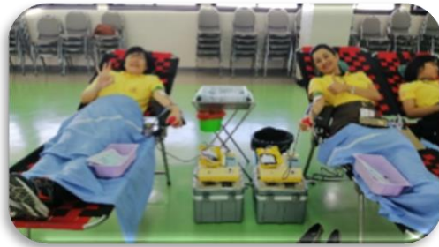
ภาพที่ 3-6 กิจกรรมเสริมสร้างทัศนคติและพฤติกรรมให้บุคลากรมีคุณธรรม จริยธรรม และธรรมาภิบาล

2) การจัดสถานที่ทำงานน่าอยู่ น่าทำงาน (Healthy Workplace) และกิจกรรมสร้างเสริมคุณภาพชีวิตที่ดีให้กับบุคลากร เช่น กิจกรรม 5 ส โครงการลดน้ำหนักเพื่อให้บุคลากรดูแลสุขภาพร่างกาย โดยมีการวัดรอบเอว และชั่งน้ำหนักประเมินค่าดัชนีมวลกาย (Body Mass Index : BMI) และกิจกรรมขยับวันละนิดร่างกายแข็งแรง เป็นต้น