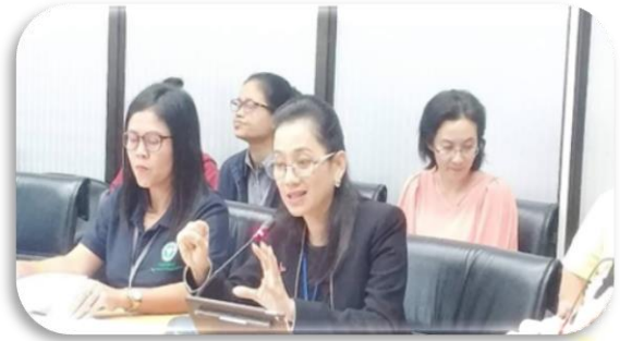
ภาพที่ 2-2 ประชุมคณะอนุกรรมการดำเนินการพัฒนาระบบราชการ (CCO) ประจำปีงบประมาณ พ.ศ. 2562