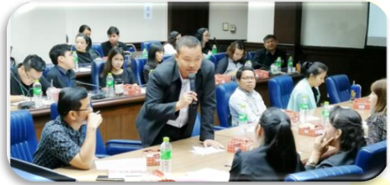
ภาพที่ 2-15 ประชุมเชิงปฏิบัติการ เรื่อง “การส่งเสริมศักยภาพนักพัฒนาองค์กร กรมควบคุมโรค ประจำปีงบประมาณ พ.ศ. 2562 ครั้งที่ 2 ผ่านระบบ VDO Conference” วันพุธที่ 29 พฤษภาคม 2562 ณ ห้องประชุมอายุรภิบาล อาคาร 1 ชั้น 2 กรมควบคุมโรค