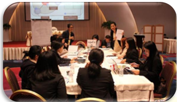
ภาพที่ 2-13 โครงการประชุมเชิงปฏิบัติการ เรื่อง “การพัฒนาศักยภาพเครือข่ายพัฒนาระบบบริหารจัดการองค์กร กรมควบคุมโรค ประจำปีงบประมาณ พ.ศ. 2562” ระหว่างวันที่ 29 – 31 ตุลาคม 2561 ณ ห้องประชุมแอมเบอร์ 2 อาคารอิมแพ็คเอ็กซิбиชันเซ็นเตอร์ ฮอลล์ 1 – 4 เมืองทองธานี