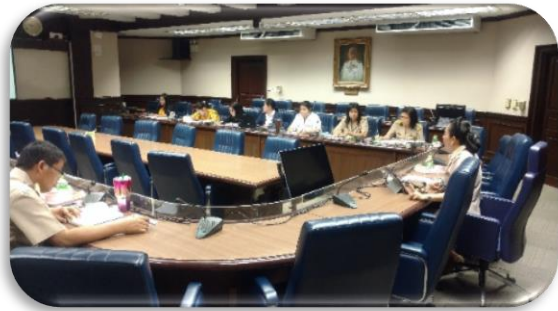
ภาพที่ 3-3 ประชุมราชการหน่วยงาน ประชุมคณะทำงานฯ ต่าง ๆ ภายในหน่วยงาน