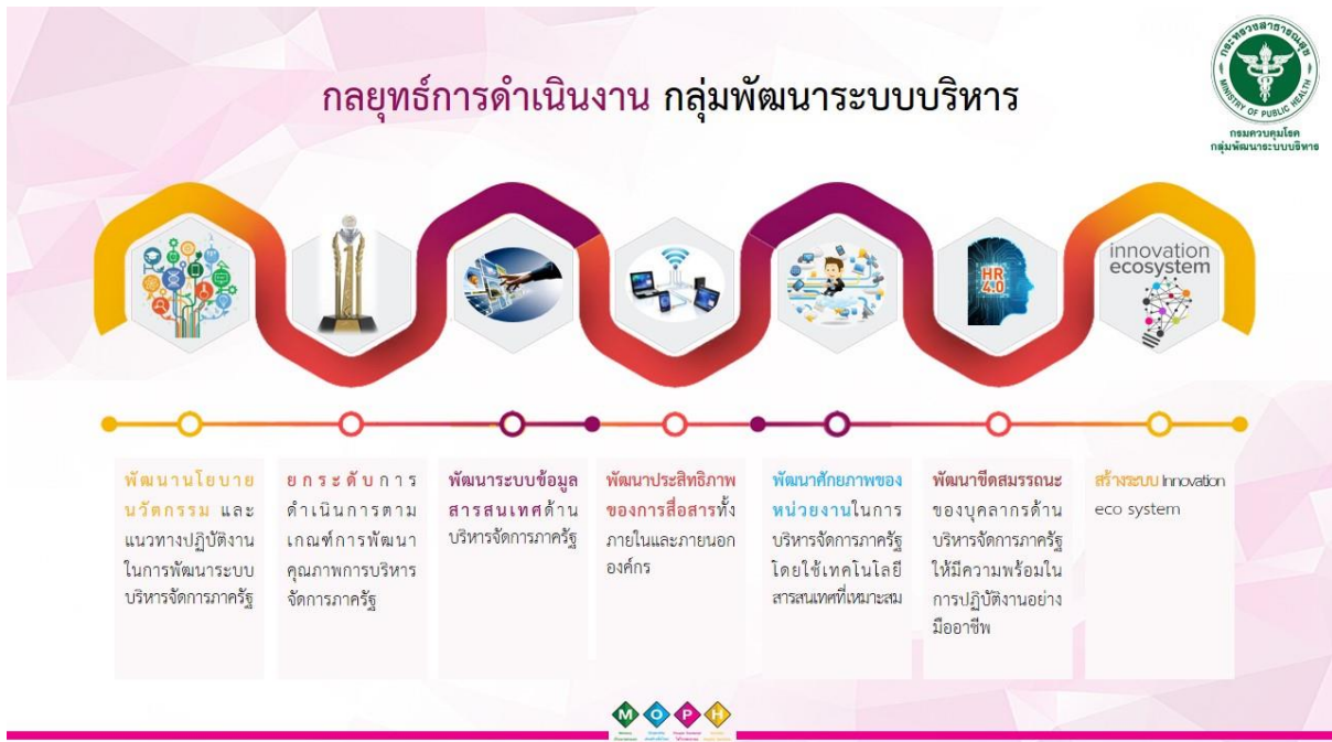
แผนภาพที่ 1 กลยุทธ์การดำเนินงาน กลุ่มพัฒนาระบบบริหาร

กรมควบคุมโรคมีระบบการบริหารจัดการภาครัฐ ที่มีประสิทธิภาพ และตอบสนองความต้องการของประชาชน