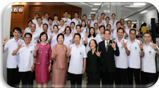
ภาพที่ 2-11 การรับตรวจประเมินรางวัลเลิศรัฐ สาขาคูณภาพการบริหารจัดการภาครัฐ ระดับดีเด่น (ตามเกณฑ์การประเมินผลสถานะของหน่วยงานภาครัฐในการเป็นระบบราชการ 4.0) ประจำปี พ.ศ. 2562 วันอังคารที่ 6 สิงหาคม 2562 ณ ห้องประชุมประเมินจันทวิมล อาคาร 1 ชั้น 1 กรมควบคุมโรค