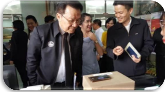
ภาพที่ 2-10 การตรวจประเมิน (Site Visit) รางวัลเลิศรัฐ สาขาบริการภาครัฐ ประเภทรางวัลนวัตกรรมการบริการ ผลงาน : นวัตกรรมทำให้บริการรักษามาลาเรียอย่างแม่นยำในพื้นที่ห่างไกล ตามแนวชายแดนไทย โดย สำนักงานป้องกันควบคุมโรคที่ 1 จังหวัดเชียงใหม่ วันอังคารที่ 17 มิถุนายน 2562 ณ ห้องประชุม 1 สำนักงานป้องกันควบคุมโรคที่ 1 จังหวัดเชียงใหม่