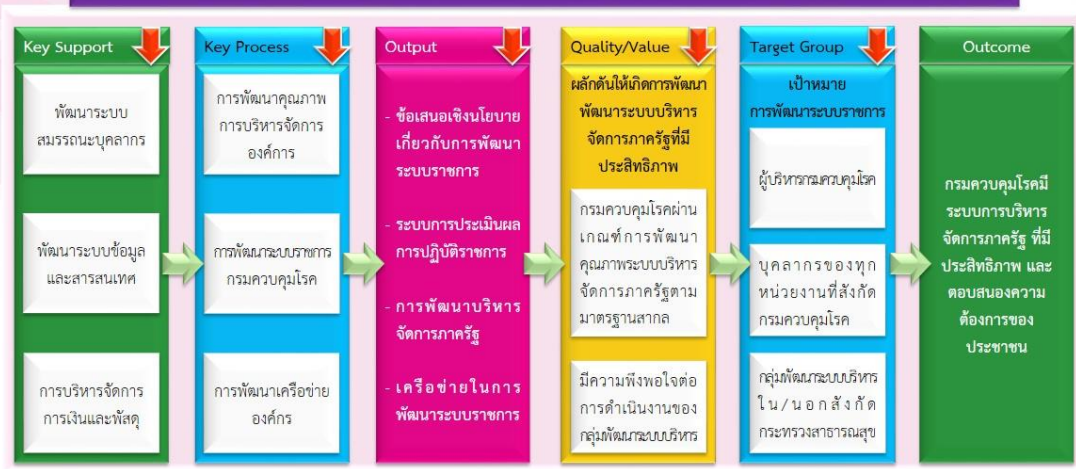
แผนภาพที่ 3 Value Chain กลุ่มพัฒนาระบบบริหาร

ความเชื่อมโยงในการกำหนดทิศทางให้สอดคล้องกับบริบทที่เปลี่ยนแปลงไปของการพัฒนาระบบราชการ