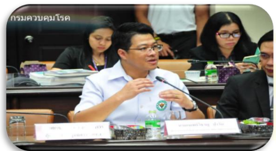
ภาพที่ 2-9 การตรวจประเมิน (Site Visit) รางวัลเลิศรัฐ สาขาการบริหารราชการแบบมีส่วนร่วม ประเภทรางวัลเปิดใจใกล้ชิดประชาชน (Open Government) ผลงาน : เปิดระบบ เปิดใจ ประชาชนร่วมลดภัยบาดเจ็บทางถนน" วันศุกร์ที่ 7 มิถุนายน 2562 ณ ห้องประเมิน จันทวิมล อาคาร 1 ชั้น 1 กรมควบคุมโรค