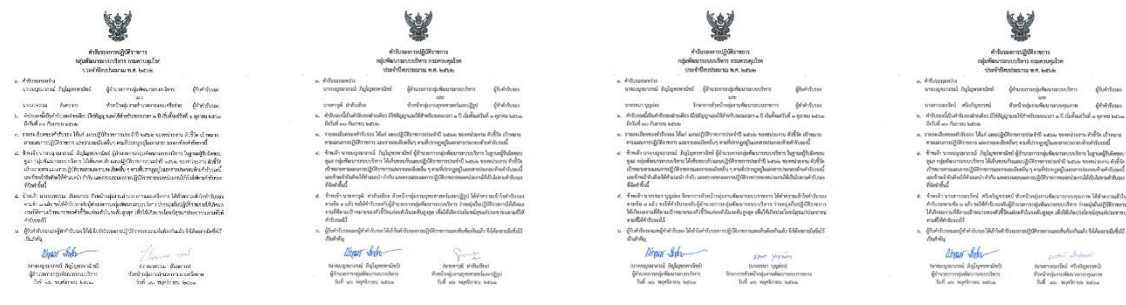
ภาพที่ 3-2 ลงนามคำรับรองการปฏิบัติราชการของหน่วยงานประจำปีงบประมาณ พ.ศ. 2562 เมื่อวันที่ 16 พฤศจิกายน 2561 ณ ห้องประชุมอายุรภิวัตน์ ชั้น 2 อาคาร 1 กรมควบคุมโรค

กลุ่มพัฒนาระบบบริหาร ได้จัดการลงนามคำรับรองการปฏิบัติราชการของหน่วยงานประจำปีงบประมาณ พ.ศ. 2562 เมื่อวันที่ 16 พฤศจิกายน 2561 ระหว่างผู้อำนวยการกลุ่มพัฒนาระบบบริหาร และหัวหน้ากลุ่มงาน โดยมี นางเบญจมาภรณ์ วิทยุไพพรพาณิชย์ ผู้อำนวยการกลุ่มพัฒนาระบบบริหาร เป็นประธาน พร้อมด้วยข้าราชการและเจ้าหน้าที่ กลุ่มพัฒนาระบบบริหาร เข้าร่วมพิธีลงนาม ณ ห้องประชุมอายุรภิวัตน์ ชั้น 2 อาคาร 1 กรมควบคุมโรค