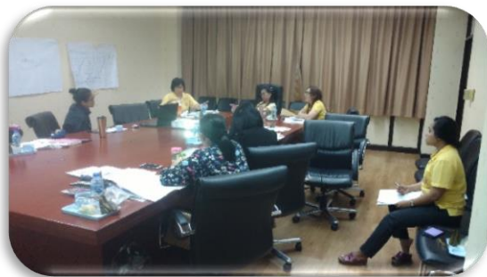
ภาพที่ 3-4 ประชุมราชการพิจารณาจัดทำสถาปัตยกรรมองค์กร (Enterprise Architecture : EA) ของกลุ่มพัฒนาระบบบริหาร ระหว่างวันที่ 22 - 23 พฤษภาคม 2562 ณ ห้องประชุมวัดชิน ชั้น 4 อาคาร 1 กรมควบคุมโรค