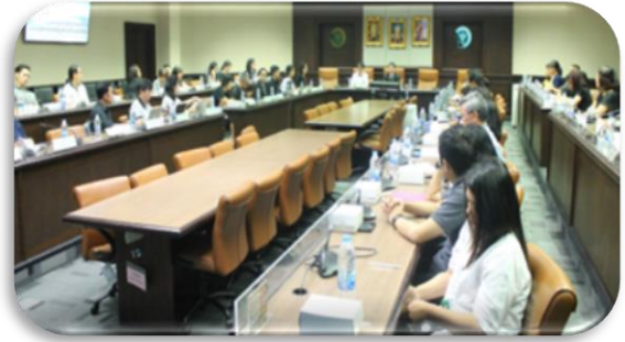
ภาพที่ 2-8 การตรวจประเมิน (Site Visit) รางวัลเลิศรัฐ สาขาบริการภาครัฐ ประเภทรางวัลนวัตกรรมการบริการ ผลงาน : ชุดซอฟต์แวร์ในการเฝ้าระวัง ป้องกัน ควบคุมโรคไข้เลือดออกอัจฉริยะ โดย กองโรคติดต่อฯ โดยแมลง วันอังคารที่ 4 มิถุนายน 2562 ณ ห้องประเมิน จันทวิมล อาคาร 1 ชั้น 1 กรมควบคุมโรค