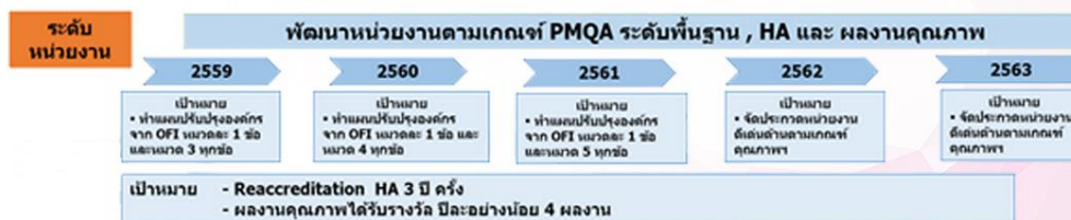
แผนภาพที่ 4 Rolling Plan การพัฒนาระบบบริหารจัดการองค์กรโดยใช้เกณฑ์ PMQA