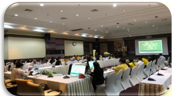
ภาพที่ 2-6 ประชุมพิจารณาบทบาท ภารกิจ และโครงสร้างของสำนักงานป้องกันควบคุมโรค ครั้งที่ 2/2562 วันพุธที่ 10 กรกฎาคม 2562 ณ ห้องประชุมเพชร อาคารเฉลิมพระเกียรติ ชั้น 7 สถาบันบำราศนราดูร

3. แต่งตั้งคณะทำงานแบ่งส่วนราชการภายในของกรมควบคุมโรค ตามคำสั่งกรมควบคุมโรคที่ 690 /2562 ลงวันที่ 7 มิถุนายน 2562 และ คณะทำงานจัดเตรียมข้อมูล แบบคำชี้แจงประกอบการแบ่งส่วนราชการภายใน ตามคำสั่งกรมควบคุมโรค ที่ 691/2562 ลงวันที่ 7 มิถุนายน 2562