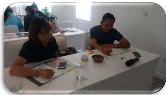
ภาพที่ 3-5 ประชุมเชิงปฏิบัติการจัดทำยุทธศาสตร์การพัฒนาระบบราชการ กรมควบคุมโรค ระหว่างวันที่ 5 – 6 มีนาคม 2562 ณ โรงแรมแคนทารี 304 จังหวัดปราจีนบุรี

งานพัฒนาองค์กร ได้ดำเนินงานตามแนวทางการพัฒนาบุคลากรของกองการเจ้าหน้าที่ มีกิจกรรมหลักในการดำเนินงาน ดังนี้