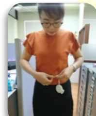
ภาพที่ 3-7 กิจกรรมสถานที่ทำงานน่าอยู่ น่าทำงาน (Healthy Workplace) และกิจกรรมสร้างเสริมคุณภาพชีวิตที่ดีให้กับบุคลากร

3) การพัฒนางานวิชาการ องค์ความรู้ ทักษะที่จำเป็นต่อการปฏิบัติงาน การส่งบุคลากรเข้ารับการอบรมในเรื่องต่าง ๆ เพื่อเสริมสร้างความรู้ความเข้าใจเกี่ยวกับหลักการ ทำงานตามการบริหารกิจการบ้านเมืองที่ดี พัฒนาศักยภาพที่ปรึกษาด้านการบริหารสำหรับหน่วยงานภาครัฐ ตลอดจนจนเทคนิคเทคโนโลยีที่สนับสนุนการทำงาน เช่น การใช้ QR Code แทนการแจกเอกสาร และการแบ่งปันความรู้ด้านเทคโนโลยีที่หน่วยงานราชการ และนักศึกษาสามารถนำไปใช้ในการปฏิบัติงานต่าง ๆ ได้