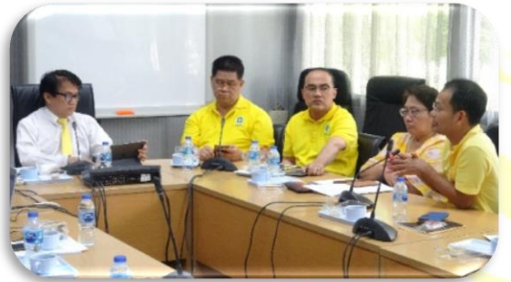
ภาพที่ 2-7 ประชุมคณะกรรมการจัดเตรียมข้อมูล แบบคำชี้แจงประกอบการแบ่งส่วนราชการภายในกรมควบคุมโรค วันอังคารที่ 25 มิถุนายน 2562 เวลา 13.30 – 16.30 น. ณ ห้องประชุมสำนักงานเลขานุการกรม อาคาร 2 ชั้น 1 กรมควบคุมโรค