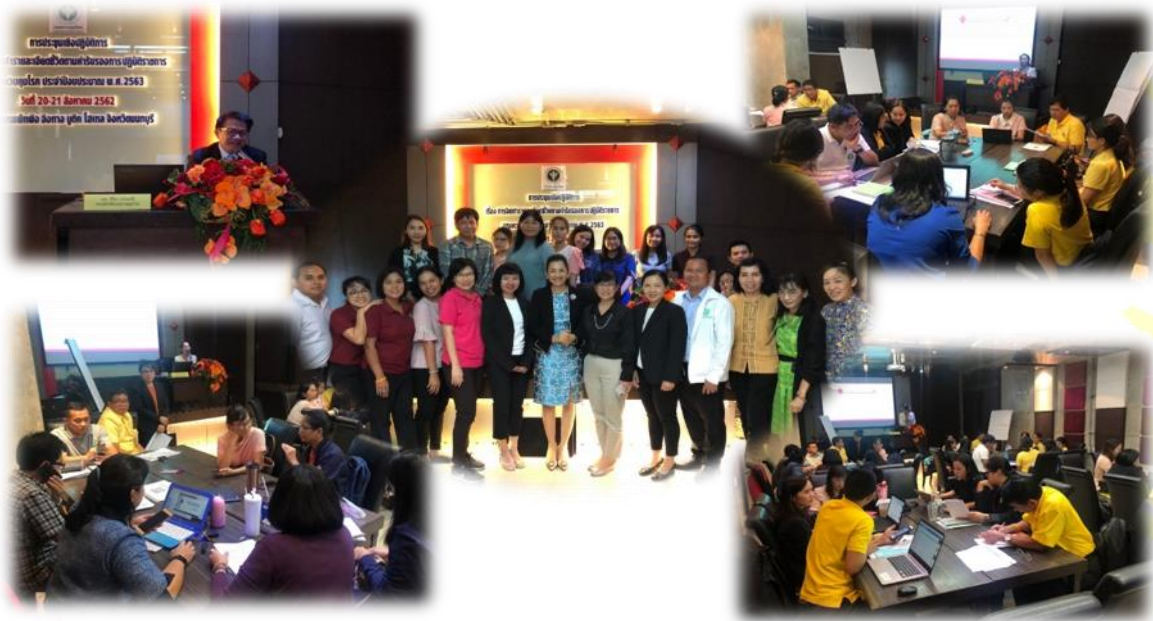
ภาพที่ 2-3 ประชุมเชิงปฏิบัติการ เรื่อง การจัดทำรายละเอียดตัวชี้วัดคำรับรองการปฏิบัติราชการหน่วยงาน กรมควบคุมโรค ประจำปีงบประมาณ พ.ศ. 2563 ระหว่างวันที่ 20 – 21 สิงหาคม 2562 ณ โรงแรมพักพิงอิงทาง โฮเทล จังหวัดนนทบุรี

ความพึงพอใจต่อการประชุมเชิงปฏิบัติการจัดทำรายละเอียดตัวชี้วัดคำรับรองการปฏิบัติราชการ ประจำปีงบประมาณ พ.ศ. 2563 คิดเป็นร้อยละ 88.67