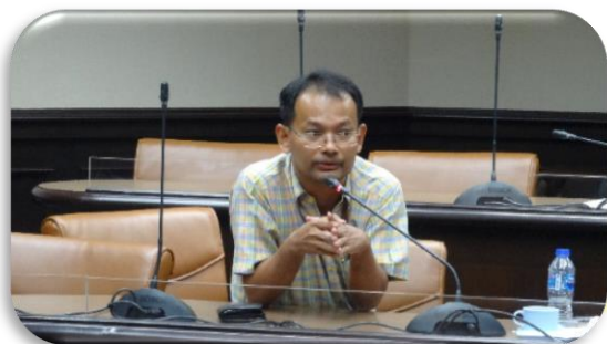
ภาพที่ 2-5 ประชุมพิจารณาบทบาท ภารกิจ และโครงสร้างของสำนักงานป้องกันควบคุมโรค ครั้งที่ 1/2562 วันพุธที่ 15 พฤษภาคม 2562 เวลา 09.00 – 16.00 น. ณ ห้องประชุมประเมินจันทวิมล อาคาร 1 ชั้น 1 กรมควบคุมโรค

2. ประชุมพิจารณาบทบาท ภารกิจ และโครงสร้างของสำนักงานป้องกันควบคุมโรค ครั้งที่ 2/2562 จากที่ประชุมครั้งที่ 1/2562 เมื่อวันที่ 15 พฤษภาคม 2562 ณ ห้องประชุมประเมิน จันทวิมล ชั้น 1 อาคาร 1 กรมควบคุมโรค ที่ประชุมได้พิจารณาตรวจสอบ โครงสร้างทั้ง 2 รูปแบบ เพื่อให้สอดคล้องกับอำนาจหน้าที่ และภาระงานของสำนักงานป้องกันควบคุมโรค ทั้งปัจจุบันและรองรับการเปลี่ยนแปลงในอนาคต จึงขอเสนอ (ร่าง) โครงสร้างของสำนักงานป้องกันควบคุมโรค ดังนี้