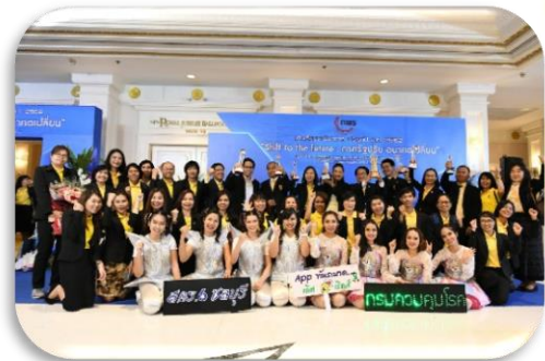
ภาพที่ 2-12 การรับรางวัลรางวัลเลิศรัฐ สาขาคุณภาพการบริหารจัดการภาครัฐ ระดับดีเด่น (ตามเกณฑ์การประเมินผลสถานะของหน่วยงานภาครัฐในการเป็นระบบราชการ 4.0) ประจำปี พ.ศ. 2562 “Shift to the future : ภาครัฐปรับ อนาคตเปลี่ยน” เมื่อวันที่ 13 กันยายน 2562 ณ ห้องรอยัล จูบิลี่ บอลรูม อิมแพ็ค เมืองทองธานี จังหวัดนนทบุรี