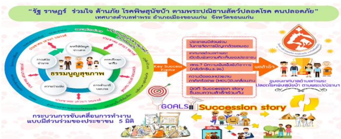
แผนภาพที่ 8 โมเดล (Model) การขับเคลื่อนการทำงานแบบมีส่วนร่วมเพื่อนำไปสู่การขยายผลการทำงานแบบมีส่วนร่วม

ปัจจัยที่ส่งผลต่อความสำเร็จ จากความร่วมมือของประชาชนในการจัดการปัญหาด้วยตนเอง “ธรรมนูญสุขภาพ” เทศบาลตำบลท่าพระ มีการเปิดรับความคิดเห็นประชาชนอย่างต่อเนื่อง สำนักงานป้องกันควบคุมโรคที่ 7 จังหวัดขอนแก่น มีความเข้มแข็งทางวิชาการเป็นคลังสำรองวัคซีน อีกทั้งความร่วมมือของภาคีเครือข่าย MOU และการมีเวที Succession story เพื่อชื่นชมความสำเร็จร่วมกัน