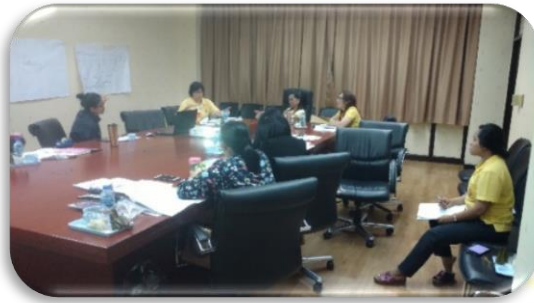
ภาพที่ 3-8 การพัฒนางานวิชาการ องค์ความรู้ ทักษะที่จำเป็นต่อการปฏิบัติงาน