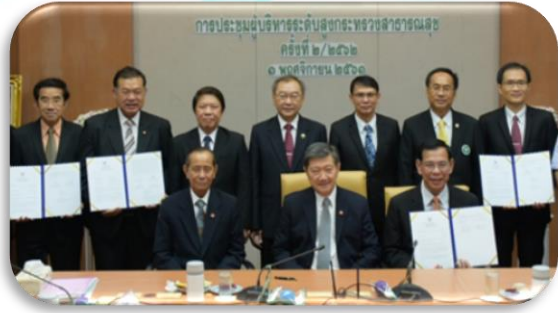
ภาพที่ 2-1 ลงนามคำรับรองการปฏิบัติราชการ ของผู้บริหารกระทรวงสาธารณสุข ประจำปีงบประมาณ พ.ศ. 2562 เมื่อวันที่ 1 พฤศจิกายน 2562

กรมควบคุมโรคได้จัดทำคำรับรองการปฏิบัติราชการ Performance Agreement : PA ประจำปีงบประมาณ พ.ศ. 2562 จำนวน 5 ตัวชี้วัด และมีผลการปฏิบัติราชการตามคำรับรองการปฏิบัติราชการ รอบ 12 เดือน (ณ วันที่ 30 กันยายน 2562) รายละเอียดดังนี้