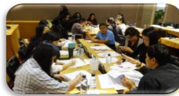
ภาพที่ 2-4 การประชุมเชิงปฏิบัติการ เรื่อง การพัฒนาศักยภาพผู้กำกับตัวชี้วัดตามคำรับรองการปฏิบัติราชการ ประจำปีงบประมาณ พ.ศ. 2562

วันที่ 15 มีนาคม 2562 ณ โรงแรมไมด้า โฮเทล งามวงศ์วาน จังหวัดนนทบุรี